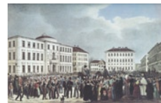
Οι Βαυαροί στρατιώτες και αξιωματικοί, μέλη του σώματος που

Για τη σημασία που είχε το συγκεκριμένο αυτό σώμα για τη νέα εξουσία αλλά και για τις αντιλήψεις υπεροχής και, τελικά, επιβολής των Βαυαρών, είναι χαρακτηριστικά τα