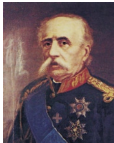
Ο αντιστράτηγος Σπύρος Μήλιος (1800-1880), αγω-

Αν κρίνουμε από τα αναλυτικό πρόγραμμα και των οκτώ τάξεων της σχολής, διαπιστώνουμε ότι στις τέσσερις πρώτες καταβαλλόταν προσπάθεια να καλυφθούν τα κενά από την ελλιπέστατη στοιχειώδη εκπαίδευση, ενώ οι τέσσερις βασικές παρείχαν υψηλή κατάρτιση, ιδίως σε ό,τι αφορά τις ανάγκες του μηχανικού (αρχιτεκτονική, οδοποιία, γεφυροποιία κλπ.). Δεν είναι τυχαίο το γεγονός ότι από το 1836 και μέχρι την ίδρυση του Μετσόβειου Πολυτεχνείου (1887) η Ευελπίδων χρησίμευε επιπλέον «διά την ανωτέραν διδασκαλίαν της αρχιτεκτονικής», όπως όριζε διάταγμα του 1836. Κυρίως, όμως, σε αντίθεση με το γενικό πλαίσιο λειτουργίας της μέσης και ανώτατης παιδείας, που ήταν διαποτισμένο από ένα πνεύμα στείρας προγονοπληξίας και απίσχνασης των θετικών επιστημών, το αναλυτικό πρόγραμμα των μαθημάτων της Ευελπίδων αποτελούσε –τηρουμένων των αναλογιών– ένα καινοτόμο εγχείρημα συστηματικότερης στροφής προς τις θετικές επιστήμες.