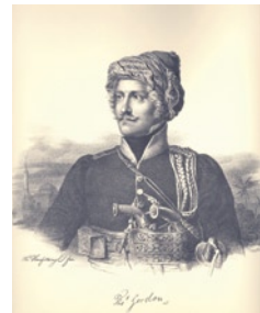
Ο Βρετανός στρατηγός και φιλέλληνας Τόμας Γκόρντον,