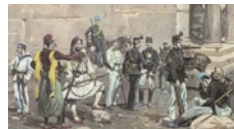
Όσοι αποφοίτουσαν από τη Σχολή Ευελπίδων και συνέ-

Κάποιες επιμέρους αλλαγές ως προς την οργάνωση της σχολής πραγματοποιήθηκαν κυρίως μετά την έξωση του Όθωνα. Έτσι, με τον νέο οργανισμό (Νοέμβριος 1864) καθορίστηκε η διάρκεια της εκπαίδευσης σε έξι χρόνια. Στη σχολή εισάγονταν νέοι ηλικίας 15-18 ετών, λαμβάνοντας γενική εκπαίδευση τριετούς διάρκειας, πριν εξειδι-