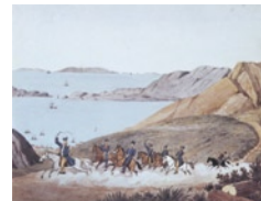
Το στρατιωτικό σώμα του Όθωνα περιελάμβανε στρατιώ-

Πράγματι, τόσο μία μερίδα του Τύπου της εποχής όσο και αρκετοί ιστορικοί δεν εφείσθησαν αρνητικών χαρακτηρισμών: «συρφετός αλητών», «τυχοδιώκτες», «σμήνον άπειρον τυχοδιωκτών πάσης της Βαυαρίας» είναι μερικοί μόνο από τους χαρακτηρισμούς που επιφυλάσσουν για τους συγκεκριμένους Βαυαρούς. Από την άλλη, ο αντιβασιλιάς Μάουρερ μόνο θετικά λόγια είχε να πει για τους συμπατριώτες του, τονίζοντας ιδιαίτερα τις τεχνικές γνώσεις ορισμένων αξιωματικών, οι οποίοι πράγματι βοήθησαν στην αναδιοργάνωση της χώρας. Η αλήθεια πάντως για το συγκεκριμένο ζήτημα πρέπει να αναζητηθεί κάπου στη μέση. Διότι μεγάλο μέρος των Βαυαρών αποφάσισαν να αφήσουν την πατρίδα τους αναζητώντας καλύτερη τύχη στην Ελλάδα, χωρίς να πληρούν τις προϋποθέσεις για να σταδιοδρομήσουν ως στρατιωτικοί. Στις εφημερίδες