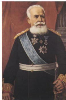
Ο «επί των Στρατιωτικών Γραμματέας της Επικράτειας» των