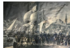
Η Έλευση του σώματος των Βαυαρών στρατιωτών στην Ελλάδα

Δεν είναι καθόλου τυχαίος, λοιπόν, ο τρόπος που δομήθηκε το στράτευμα τα πρώτα χρόνια της οθωνικής περιόδου. Κάθε τάγμα απαρτιζόταν από 3 ελληνικούς και 3 βαυαρικούς λόχους, έτσι που οι δεύτεροι να παίζουν ρόλο επιτήρησης στους πρώτους. Το σπουδαιότερο, βέβαια, ήταν ότι Βαυαροί είχαν τοποθετηθεί σε καίριες στρατιωτικές θέσεις, ώστε ο έλεγχος του στρατιωτικού μηχανισμού να είναι απόλυτος. Έτσι, ο G.W. Lesuire ανέλαβε Γραμματέας (υπουργός) των Στρατιωτικών, ο Ch. Schmaltz γενικός επιθεωρητής του στρατού αλλά και για μεγάλο διάστημα επίσης υπουργός Στρατιωτικών, ο Fuchs ανέλαβε γενικός διοικητής φρουριών και ναυστάθμων, ο Zech τοποθετήθηκε διοικητής του Μηχανικού και ο Luders διοικητής του πυροβολικού. Επιπλέον, ο Άγγλος Th. Gordon διορίστηκε αρχηγός του Γενικού Επιτελείου και ο Γάλλος Fr. Graillard αρχηγός της Χωροφυλακής. Όλοι αυτοί οι διορισμοί λαμβάνουν χώρα τη δεκαετία της απολυταρχίας, κατά τη διάρκεια της οποίας σημειώνονται αλληπάλληλες μεταβολές στην ηγεσία του στρατεύματος, χωρίς ωστόσο να αφίστανται από τον κύριο στόχο, ο οποίος ήταν ο απόλυτος έλεγχος του κατασταλτικού μηχανισμού του κράτους. Κυρίως, όμως, δεν μπορεί να ειπωθεί το συγκεκριμένο ζήτημα ανεξάρτητα από την πολιτική