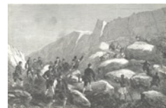
Η αντιμετώπιση της ληστείας υπήρξε κύριο στόχος των

Στην Εθνοφυλακή ήταν υποχρεωμένοι να καταταγούν, κατόπιν κληρώσεως, όλοι οι Έλληνες ηλικίας 25-50 ετών, με κάποιες εξαιρέσεις, όπως κληρικοί, δημόσιοι υπάλληλοι, «αγύρται, τυχοδιώκται, αργοί» κ.ά. Καθοριστικό ρόλο στην αποφυγή της ένταξης στην Εθνοφυλακή, όπως και στη στράτευση γενικότερα, έπαιζε η κοινωνική και οικονομική δυνατότητα της οικογένειας, καθώς λειτουργούσε η άτυπη και παράνομη συναλλαγή με τους τοπικούς άρχοντες, όπως επίσης και τα δίκτυα πελατείας-προστασίας με τους τοπικούς πολιτευτές να συντελούν στη διαβλητότητα της κλήρωσης υπέρ των ευνοουμένων τους. Η απροθυμία για κατάταξη είχε και μία επιπλέον αφορμή: η συστράτευση στην Εθνοφυλακή για την καταδίωξη των ληστρικών συμμοριών εμπεριείχε κινδύνους για τις οικογένειες των εθνοφυλάκων, καθώς οι ληστές στρέφονταν με εκδικητική μανία εναντίον τους. Το 1862 η Εθνοφυλακή αναδιοργανώθηκε και διαιρέθηκε σε δύο τμήματα, στην Ενεργό, όπου ανήκαν οι άνδρες ηλικίας 20-50 ετών, και σε