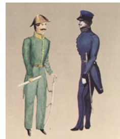
Το Μηχανικό ήταν ένα μαχητικό ανενεργό σώμα, όμως προσέ-