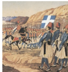
Στρατιώτες και αξιωματικοί από τη Μάνη και τη Ρούμελη που

Ένα από τα μεγάλα προβλήματα που είχε να αντιμετωπίσει το ελληνικό κράτος από τα πρώτα χρόνια ήταν η τύχη των αγωνιστών του 1821. Στην αντιμετώπιση αυτού του ηθικά και εθνικά ευαίσθητου ζητήματος προσπάθησε το κράτος να δώσει λύση με τη δημιουργία της Βασιλικής Φάλαγγας το 1835. Το ιδρυτικό διάταγμα της 18ης (30ής) Σεπτεμβρίου δικαιολογεί την ανάγκη ίδρυσης του σώματος ως «δείγμα της βασιλικής ευνοίας και της ευγνωμοσύνης της πατρίδος εις τους γενναίους άνδρας (...) και δια να δώσωμεν ευκαιρίαν να διαπρέψωσιν εις την φωνήν του Βασιλέως των διανέων εκδουλεύσεων, έχοντες υπ' όψιν την οικονομικήν κατάστασιν του Βασιλείου». Έτσι, η ένταξη σε ένα στρατιωτικό σώμα όσων το μόνο που διέθεταν στη συγκεκριμένη συγκυρία ήταν η γνώση της πολεμικής τέχνης, και ένα από τα λίγα επαγγέλματα που μπορούσαν να εξασκήσουν ήταν το στρατιωτικό, φαινόταν να αποτελεί μία διέξοδο για τους ίδιους αλλά και ένα στήριγμα της νέας εξουσιαστικής αρχής. Οι «εκδουλεύσεις», προς τον θρόνο αυτή τη φορά, των πρώην αγωνιστών θα λειτουργούσαν ως μηχανισμός ενσωμάτωσης στις κρατικές λειτουργίες και θα τους απομάκρυνε από πιθανές εκτροπές αντικυβερνητικής φύσεως, οι οποίες ήδη είχαν κάνει την εμφάνισή τους στα δύο πρώτα χρόνια της αντιβασιλείας. Βέβαια, η πρόταση «έχοντες υπ' όψιν την οικονομικήν κατάστασιν του Βασιλείου» αποτελούσε μια υπαινικτική αναφορά στα πενιχρά