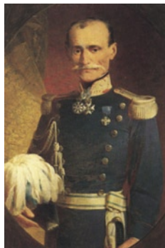
Ο Κώστας Μπότσαρης (1792-1853), αγωνιστής του 1821,

Δικαίωμα επανακατάταξης στον στρατό είχαν όσοι είχαν υπηρετήσει πριν από την 1η Δεκεμβρίου 1831 αλλά και αυτοί υπό ορισμένες προϋποθέσεις. Ορίστηκαν μάλιστα και τρία κέντρα κατάταξης. Για όσους έμεναν έξω από τους καταλόγους των διορισμένων συστάθηκε ειδική επιτροπή, στην οποία θα μπορούσαν να προσφύγουν οι ενδιαφερόμενοι κομιζοντας τα αποδεικτικά των υπηρεσιών τους κατά την Επανάσταση. Την επιτροπή, επικεφαλής της οποίας ήταν ο Γραμματέας των Στρατιωτικών, αποτελούσαν οκτώ επιφανείς προσωπικότητες του Αγώνα: Κώστας Μπότσαρης, Ανδρέας Λόντος, Βάσος Μαυροβουνιώτης, Δημήτριος Πλαπούτας, Γεώργιος Γιατράκος, Δημήτριος Μακρής, Πανουργιάς Πανουριάς και Αλεξάκης Βλαχόπουλος. Με μια πρόχειρη ματιά διαπιστώνεται η αντιπροσωπευτικότητα των μελών της επιτροπής ως προς τον τόπο προέλευσης (ετερόχθονες, Στερεοελλαδίτες και Πελοποννήσιοι) ή τον κομματικό προσανατολισμό (Αγγλικό, Γαλλικό ή Ρωσικό Κόμμα), γεγονός που φανερώνει την πρό-