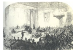
Στην περίπτωση της ανάγκης για αντιμετώπιση εγκλημάτων

Το προνόμιο απονομής χάριτος του μονάρχη καθώς και της σύστασης εκτάκτου στρατοδικείου ήταν ένα ακόμη ενισχυτικός συντελεστής των εξουσιών του Όθωνα, τον οποίο χρησιμοποίησε επιδέξια η κεντρική εξουσία για να εφαρμόσει την πολιτική της. Συγκεκριμένα, τα αυστηρά μέτρα καταστολής απέβλεπαν στην περιστολή του ληστικού φαινομένου. Από την άλλη, η απονομή χάριτος λειτουργούσε ως μέσο εκτόνωσης της δυσφορίας και ως μέτρο ευεργεσίας του μονάρχη προς τους παρανομούντες, οι οποίοι, εκφράζοντας την ευαρέσκειά τους προς το κράτος, θα μπορούσαν να γίνουν λειτουργοί του με αποστολή τη δίωξη της ληστείας. Η παροχή χάριτος ή αμνηστίας από τον Όθωνα ήταν συχνή και παρουσιαζόταν συνήθως έπειτα από μία εκτεταμένη και σοβαρή έντασης ανταρσία. Ενδεικτικό ήταν το διάταγμα του 1834 «Περί αμνηστίας