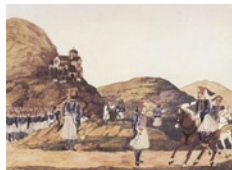
Αξιωματικοί και οπλίτες από τη Ρούμελη, στρατιώτες πεζικού

Με τη Βασιλική Φάλαγγα συνδέθηκε και ένα άλλο σημαντικό πρόβλημα της ελληνικής κοινωνίας του 19ου αιώνα, το ζήτημα των εθνικών γαιών. Την 1η (13η) Ιανουαρίου 1838 με νόμο προβλεπόταν η παραχώρηση εθνικών κτημάτων στους αξιωματικούς του σώματος. Ο νόμος στηριζόταν στο σκεπτικό ότι έπρεπε να παρασχεθεί «διάρκης ασφάλεια» στους «εν ενεργεία ενδεείς αξιωματικούς». Προϋπόθεση για την παραχώρηση της γης ήταν η προηγούμενη παραιτήση από τον μισθό του φαλαγγίτη. Ανάλογα με το ύψος του μισθού καθοριζόταν η έκταση του παραχωρούμενου κλήρου. Ο λόγος που οδήγησε το κράτος στην ίδρυση της λεγόμενης προικοδοτημένης φάλαγγας ήταν