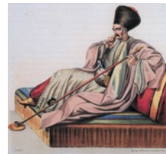
Η ίδρυση της προικοδοτημένης φάλαγγας είχε στόχο να εμπο-