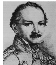
Ο συνταγματάρχης Κάρολος Έυδεκ, ως μέλος της Αντιβα-

Αυτή η ζοφερή κατάσταση έπρεπε να ανατραπεί και η νέα κεντρική εξουσία έθεσε ως πρώτη προτεραιότητα την αντιμετώπιση του προβλήματος των ατάκτων στρατευμάτων, τα οποία μπορούσαν να λειτουργήσουν δύναμις ως φορείς αμφισβήτησης, ίσως και ανατροπής της κεντρικής εξουσίας. Με το Β.Δ. της 2ας (14ης) Μαρτίου 1833, «Περί διαλύσεως των ατάκτων στρατευμάτων», επιχειρήθηκε η διάλυση των ενόπλων ομάδων. Αποκλείστηκαν μάλιστα όλοι εκείνοι, οι υπαξιωματικοί και οι στρατιώτες, που είχαν καταταγεί μετά την 1η Δεκεμβρίου 1831 από τον νέο Τακτικό Στρατό (άρθρο 2 του διατάγματος). Το σκεπτικό αυτής της απόφασης βασιζόταν στην άποψη ότι πολλοί, εκμεταλλεόμενοι τις εμφύλιες έριδες των ετών 1831-1832, απέκτησαν παράνομα στρατιωτικούς τίτλους και, κυρίως, ότι ήταν συνδεδεμένοι με τις παρατάξεις εκείνες