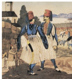
Άνδρες μονάδας πεζικού από τη Μάνη και τη Ρούμελη σε ύδατο-