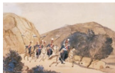
Το ιππικό, σώμα του Τακτικού Στρατού η λειτουργία του

Το σώμα των Ακροβολιστών, ως επικουρικό του πεζικού, είχε μάλλον τιμητικό και συνταξιοδοτικό χαρακτήρα, αν μάλιστα ληφθεί υπόψη το γεγονός ότι δεν γίνονταν δεκτοί όσοι ήταν κάτω από τριάντα ετών, αλλά ούτε προβλεπόταν η ένταξη νέων στρατιωτικών, αφού το σώμα θα διατηρείτο για μια γενιά. Τα τάγματα αυτά έχασαν τη