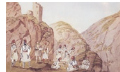
Το σώμα των οροφυλάκων διαλύθηκε το 1854 στην προ-

Από τους πίνακες της μισθοδοσίας προκύπτει ότι οι αξιωματικοί και οι υπαξιωματικοί του ιππικού, του πυροβολικού και του μηχανικού, απολάμβαναν υψηλότερους μισθούς, σε σχέση με τους συναδέλφους τους των άλλων σωμάτων. Για παράδειγμα, ο λοχαγός του πεζικού, σύμφωνα με το ιδρυτικό διάταγμα του 1833, είχε μηνιαίο μισθό 200 δραχμές, των Ακροβολιστών 120, του ιππικού 220, του πυροβολικού και του Μηχανικού ομοίως. Αυτό εξηγείται αν λάβουμε υπόψη ότι τα τρία αυτά συγκεκριμένα σώματα προϋπέθεταν ειδικές γνώσεις και ιδιαίτερη παιδεία. Επιπλέον, ο μισθός διακρινόταν σε μισθό βαθμού και μισθό υπηρεσίας. Ο πρώτος ήταν συνήθως ο ίδιος για όλους τους αξιωματικούς και υπαξιωματικούς, ενώ ο δεύτερος σχετιζόταν με την άσκηση διοικητικών καθηκόντων και άλλων σημαντικών υπηρεσιών. Από τη διάκριση αυτή προέκυπταν ανισότητες μεταξύ των στρατιωτικών –άρα και φανερές ή υπέρπουσες αντιπαλότητες– καθόσον μάλιστα ο μισθός υπηρεσίας ήταν πολύ υψηλότερος από αυτόν του βαθμού, ενώ παράλληλα συνοδευόταν και από άλλα προνόμια, όπως, για παράδειγμα, παροχή στέγης στην οικογένεια του αξιωματικού. Εφόσον το κράτος δεν μπορούσε να εξασφαλίσει στέγη, παρείχε ένα είδος επιδότησης ενοικίου. Συγκρίνοντας τους μισθούς των