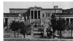
Μέχρι την ίδρυση του Μετσόβειου Πολυτεχνείου, το 1887, η

Βασικό μέλημα της εκάστοτε ηγεσίας του Υπουργείου Στρατιωτικών ήταν να τοποθετούνται στη διοίκηση της σχολής πρόσωπα της απόλυτης εμπιστοσύνης του και αυτό είναι μάλλον ευνόητο. Με εξαίρεση τον Σπύρο Μήλιο, η διοίκηση του οποίου συνέπεσε με τη συνταγματική μεταβολή του 1843, όλοι οι διοικητές πληρούσαν αυτήν την προϋπόθεση, άσχετα από το γεγονός ότι πολλοί Ευέλπιδες ανέπτυξαν, κατά καιρούς, αντικυβερνητικές δραστηριότητες. Το 1839 εκδηλώθηκαν πράξεις βίας από ορισμένους