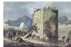
Όσοι αγωνιστές δεν μπόρεσαν να συμπεριληφθούν στα νεο-

Επιπλέον, η λειτουργία της χωροφυλακής οδήγησε συχνά σε μία μετωπική αντιπαράθεση μεταξύ των Ελλήνων. Από τη μία μεριά ήταν οι νομοταγείς, εκείνοι που υπηρετούσαν, στήριζαν ή έστω ανέχονταν την κρατική εξουσία, και από την άλλη οι «παράνομοι», όλοι όσοι επέλεξαν τη σύγκρουση.