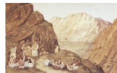
Η απονομή χάριτος σε ληστές εκ μέρους του μονάρχη εντασ-