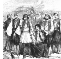
Η λαϊκή συνείδηση της εποχής ήταν συχνά ευνοϊκή προς τους

Η ένταξη στο συγκεκριμένο σώμα εμπεριείχε μία επιλογή με ιδιαίτερο νόημα και συχνά λειτουργούσε αρνητικά στη λαϊκή συνείδηση, αν ληφθεί υπόψη ότι μια σημαντική μερίδα του λαού διέκειτο ευνοϊκά προς τους ληστές, έστω και από αντίδραση προς την πολιτική της κεντρικής εξουσίας. Πολλές φορές τα ληστρικά κυκλώματα σχημάτιζαν ένα, ιδεολογικά θολό, αντιδυναστικό μέτωπο –ιδιαίτερα μέχρι το 1862– το οποίο περιλάμβανε ετερόκλητα στοιχεία κάθε μορφής. Μολονότι αυτό δημιούργησε ανάμεικτα συναισθήματα τρόμου και θαυμασμού, δημιουργείται η εντύπωση, μέσα στα δημοτικά τραγούδια του 19ου αιώνα, ότι υπερισχύει ο θαυμασμός ή έστω η συμπάθεια απέναντι στους ληστές. Σε άρθρο του στρατιωτικού περιοδικού Ονήσανδρος , του 1865, διαβάζουμε: «Τον ληστήν και εις την λαιμητόμον φερόμενον η γνώμη των πολλών δεν περιβάλλει με τον άτιμον του κακούργου μανδύα· τον λυπάται μάλιστα και ασμένως ακούουσα το τελευταίον του γηστρικών άσμα ένδακρις επιφωνεί: "κρίμα το παλγκάρι". Ο ληστής (...) θύμα απανθρώπων νόμων λογιζόμενος αναβαίνει μεθ' υπερηφανείας εις το ικρίωμα». Στον αντίποδα, η χωροφυλακή συγκεντρώνει τα πυρά της κριτικής, εξαιτίας όχι μόνο της αντίθεσης προς την εκάστοτε κυβερνητική πολιτική, αλλά και της συμπεριφοράς των ανδρών της οι οποίοι υπερέβαλαν σε ζήλο προκειμένου να αποδείξουν την αφοσίωσή τους προς την ηγεσία. Μέσα από τις σελίδες του περιοδικού Στρατιωτικός Άγγελος το 1845 καταγγελλόταν η βάναυση συμπεριφορά των χωροφυλά-