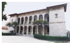
Το μέγαρο της Δούκισσας Πλακεντίας, το κτίριο που σήμερα