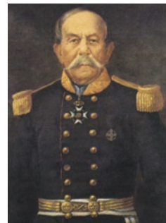
Ο Κωνσταντίνος Βλαχόπουλος, Φιλικός και αγωνιστής του 1821,