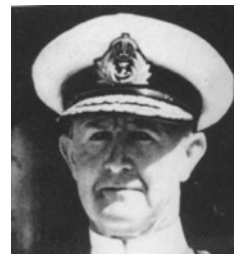
Ο Βρετανός ναύαρχος Άντριου Κίνιγκχαμ.

Ακόμα και η συμμετοχή του ΕΑΜ στην κυβέρνηση δεν ικανοποιούσε τον Τσώρτσιλ, διότι το ΕΑΜ επικρατούσε σε μεγάλα τμήματα της Ελλάδας. Φοβόταν ότι, μετά τον πόλεμο, τα Βαλκάνια θα κυριαρχούνταν από τους κομμουνιστές και θα περιέρχονταν στη σοβιετική σφαίρα επιρροής. Οι στόχοι της βρετανικής πολιτικής καθορίστηκαν με μεγαλύτερη σαφήνεια στις 7 Ιουνίου 1944, οπότε, σε μνημόνιο που υπέβαλε ο Ήντεν στο πολεμικό