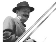
Ο Γεώργιος Καρτάλης υπήρξε από τους πρώτους πολιτικούς

Παράλληλα με τις προετοιμασίες για την επιχείρηση MANNA , η βρετανική κυβέρνηση προσπαθούσε να ενοποιήσει τα αντιστασιακά κινήματα στην Ελλάδα, κάτι που επιτεύχθηκε μερικώς, με τη συμφωνία της Καζέρτας στις 26 Σεπτεμβρίου του 1944, η οποία έθεσε τις ελληνικές αντάρτικες δυνάμεις υπό την ηγεσία του στρατηγού Ρόναλντ Σκόμπι (Ronald Scobie). Παρά τη συμφωνία, ο Τσώρτσιλ εξακολουθούσε να υποπεύεται το ΕΑΜ και επεδίωξε να εξασφαλίσει την εκ των προτέρων κατηγορηματική δέσμευση της Σοβιετικής Ένωσης, για την αποστολή βρετανικών δυνάμεων στην Ελλάδα (οι σοβιετικοί είχαν ήδη απαντήσει ότι αποδέχονται την αποστολή των Βρετανών και ότι δεν θα στείλουν δικά τους στρατεύματα στην Ελλάδα). Γι' αυτόν τον λόγο αποφάσισε να μεταβεί μαζί με τον Ήντεν στη Μόσχα. Κατά τις συνομιλίες (9-11 Οκτωβρίου 1944) ο Τσώρτσιλ και ο Στάλιν έπειτα από σκληρές διαπραγματεύσεις καθόρισαν τις ζώνες επιρροής τους στη μεταπολεμική Ευρώπη. Στις 10 και 11 Οκτωβρίου οι υπουργοί Εξωτερικών της Βρετανίας και της Σοβιετικής Ένωσης συμφώνησαν ότι η ΕΣΣΔ δικαιούται το 80% της επιρροής στη Βουλγαρία και την Ουγγαρία και η Βρετανία το υπόλοιπο 20%, ενώ η ευθύνη τους για τη Γιουγκοσλαβία θα μοιράζονταν εξίσου. Ήδη είχε συμφωνηθεί ότι τα αντίστοιχα ποσοστά για την Ελλάδα θα ήταν 90% στη Μεγάλη Βρετανία