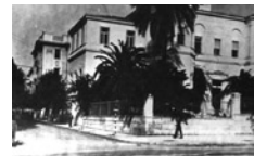
Το άντρο της Γκεστάπο, στην οδό Μέρλιν, απειλητικό όργανο