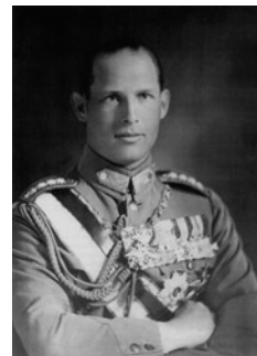
Η Βρετανία απέβλεπε στην προοπτική επιστροφής της εξ-

Διεργασίες σε σχέση με το ΕΑΜ ξεκίνησαν και στη Μέση Ανατολή. Ο Αρχηγός της SOE (Καΐρου) Τέρενς Μάξγουελ (Terence Maxwell), εκτιμούσε ότι διαμορφώθηκε μια καινούργια κατάσταση αποτέλεσμα των αλλαγών στην ελληνική κυβέρνηση, όταν ο Κανελλόπουλος έγινε αντιπρόεδρος και του δόθηκε από την κυβέρνηση η αρμοδιότητα για την ανάπτυξη των αναρπειακών δραστηριοτήτων στην Ελλάδα. Το πρόβλημα ήταν η χρηματοδότηση των οργανώσεων στην Ελλάδα, από τη στιγμή που υπήρχαν οργανώσεις, οι οποίες είτε δε συμπαθούσαν, είτε δεν ήταν έτοιμες να συνεργαστούν με την ελληνική κυβέρνηση. Από την άλλη, αν τα χρήματα και οι προμήθειες περνούσαν στις οργανώσεις διαμέσου του Κανελλόπουλου θα δημιουργούνταν πρόβλημα αφού δεν τον αναγνώριζαν ως αντιπρόσωπο και αρχηγό τους. Έτσι, ο Μάξγουελ πρότεινε η SOE να συνεχίσει, κατά την παρούσα φάση, να χρηματοδοτεί αυτές τις οργανώσεις ανεξάρτητα. Οι προτάσεις αυτές εγκρίθηκαν από την αρμόδια επιτροπή της SOE, στη