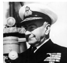
Ο αντιναύαρχος Πέτρος Βούλγαρης ανέλαβε αρχηγός του