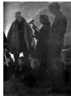
Ο Ναπολέων Ζέρβας ανάμεσα σε συγκεντρωμένη ομάδα