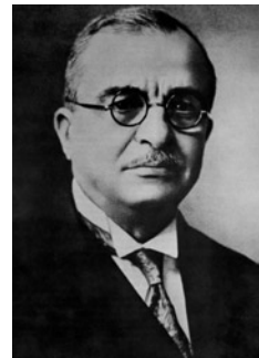
Ο πρωθυπουργός Ιωάννης Μεταξάς, πρωταγωνιστής των