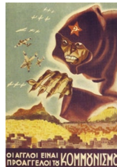
Προπαγανδιστική αφίσα της προόδου 1943-44 εναντίον των

Η ομάδα του Προμηθέα II είχε σχεδιάσει να τοποθετήσει εκρηκτικά σε πλοίο ενώ έμπαινε στη διώρυγα, και καθώς θα την διέσχιζε θα ανατινάζονταν με αποτέλεσμα τον αποκλεισμό της διώρυγας. Δυο συνεργάτες του Προμηθέα II ανέλαβαν το εγχείρημα, αλλά, ενώ πλησίαζαν με βάρκα, συνελήφθησαν από Ιταλούς, με αποτέλεσμα η προ-