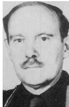
Ο συνταγματάρχης Στιούαρτ Γκράχαμ Μένζις ανέλαβε αρχη-