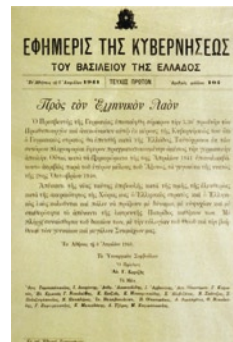
Η εφημερίδα της κυβέρνησης της 6ης Απριλίου 1941 ανακοινώνει

Όλες αυτές οι διεθνείς εξελίξεις ανησύχσαν το βαλκανικά κράτη, αλλά η κυρίαρχη