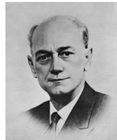
Ο Παναγιώτης Κανελλόπουλος φτάνει την άνοιξη του 1942 στη

Κατά τη διάρκεια της απουσίας του Κανελλόπουλου στο Λονδίνο για σαράντα ημέ-