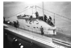
Το Ελληνικό υποβρύχιο «Παπανικολής» στο οποίο επιβιβά-

Στις 8 Ιανουαρίου του 1943 η ομάδα επιβιβάσθηκε στη Βηρυτό στο ελληνικό υποβρύχιο Παπανικολής και το βράδυ της 17ης Ιανουαρίου έφτασε στην περιοχή Μπούφι του Πόρου. Επικεφαλής της ομάδας LOCKSMITH είχε τεθεί ο έφεδρος πλωτάρχης Κλοντ Μάικλ Κάμπερλεντς (Claude Michael Bulstrode Cumberledge), η οποία μετέφερε μαζί της δυο συσκευές ασυρμάτου, μια μικρή βάρκα και τις ειδικές μαγνητικές νάρκες (τέσσερις τον αριθμό, μαζί με τέσσερις αντί - νάρκες) που είχαν κατασκευαστεί από τη Σχολή Ειδικής Ναρκοθέτησης (Special Mining School) σε συνεργασία με τον αρχηγό της αποστολής Κάμπερλεντς, ο οποίος ήταν και ο εφευρέτης τους. Ο μηχανισμός των ειδικών αυτών νάρκων θα ενεργοποιούνταν μόνο όταν πλοίο συγκεκριμένου μήκους περνούσε από πάνω τους. Η εκρηκτική ύλη που περιλάμβαναν οι τέσσερις νάρκες (440