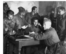
Κατά την ανατίναξη του περάσματος του Σαραντάπορου

Οι αξιωματικοί της Συμμαχικής Στρατιωτικής Αποστολής έλαβαν οδηγίες για την εκτέλεση της επιχείρησης και αμέσως ξεκίνησαν την προετοιμασία. Για να εκτελεστεί όμως πιο αποτελεσματικά θα έπρεπε η Αποστολή να αναδιοργανωθεί. Σύμφωνα με το επιχειρησιακό σχέδιο οι τρεις κεντρικές περιοχές της αντάρτικης δραστηριότητας, ΕΛΑΣ και ΕΔΕΣ στην ηπειρωτική Ελλάδα και η Πελοπόννησος, θα ελέγχονταν απευθείας από το Κάιρο, και θα έπαιρναν οδηγίες από έναν ανώτερο αξιωματικό. Η ανακατανομή των αντάρτικων δυνάμεων μπορεί να θεωρηθεί ότι εξυπηρετούσε πολιτικές σκοπιμότητες για τον περιορισμό του ΕΛΑΣ και την απομόνωσή του – για την ικανοποίηση των αιτημάτων του Βρετανικού Υπουργείου Εξωτερικών. Κάτι τέτοιο όμως δεν προκύπτει, τουλάχιστον κατά την προετοιμασία της επιχείρησης, η οποία είχε αμιγώς στρατιωτικό χαρακτήρα.