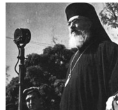
Ο αρχιεπίσκοπος Δαμασκνός κλήθηκε από τον Τσουδερό (με

Όλη αυτή η δυσμενής κατάσταση οδήγησε σε στρατιωτικοπολιτική κρίση τον Απρίλιο του 1944. Έτσι, μέσα σε μια δύσκολη ατμόσφαιρα, οι υπουργοί της κυβέρνησης Τσουδερού υποβάλλουν τις παραιτήσεις τους στις 5 Απριλίου και στις 13 Απριλίου διορίζεται πρωθυπουργός της Ελλάδας ο Σοφοκλής Βενιζέλος. Εν τω μεταξύ οι Βρετανοί είχαν πάρει τη στρατιωτική κατάσταση στα χέρια τους με στόχο τον αφοπλισμό και τη διάλυση του ελληνικού στρατού. Συλλαμβάνουν μέλη των οργανώσεων ΑΣΟ και ΕΑΣ, αφοπλίζουν διάφορα στρατιωτικά τμήματα και στέλνουν τους στρατιώτες σε στρατόπεδα, ενώ βρετανικά τεθωρακισμένα οχήματα αποκλείουν το Υπουργείο των Ναυτικών. Οι ναύτες αντιδρούν: καταλαμβάνουν τα πλοία και όσοι κυβερνήτες δεν θέλησαν να