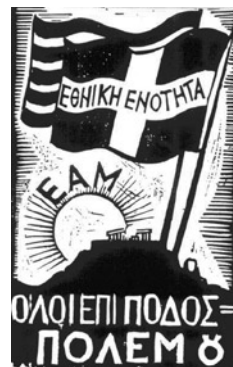
Αφίσα, στην οποία το ΕΑΜ καλεί τον λαό να περιφρουρήσει την