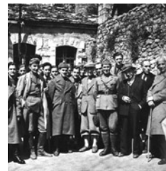
Στελέχη του νεοσύστατου ΠΕΕΑ, σε αναμνηστική φωτογραφία.

Ενόψει της απελευθέρωσης της Ελλάδας, οι Βρετανοί επιθυμούσαν να προκύψει μέσα από το συνέδριο μια κυβέρνηση με ευρεία βάση, στην οποία θα συμμετείχε και το ΕΑΜ. Με αυτόν τον τρόπο θα μπορούσε η ελληνική κυβέρνηση και οι Βρετανοί να εξασφαλίσουν την ειρηνική επιστροφή τους στην Ελλάδα. Θα έπρεπε όμως να τεθούν εμπόδια