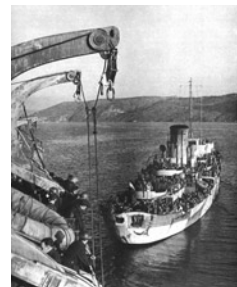
Πλοίο μεταφέρει βρετανικά στρατεύματα κατά την εκκεί-

Την άνοιξη του 1942 η κυβέρνηση ενισχύθηκε σημαντικά με την έλευση του Παναγιώτη Κανελλόπουλου στη Μέση Ανατολή. Στα μέσα Απριλίου του 1942 όταν ο Κανελλόπουλος έφτασε στην Αίγυπτο, έχοντας διαφύγει από την Ελλάδα, ξεκίνησε συζητήσεις με