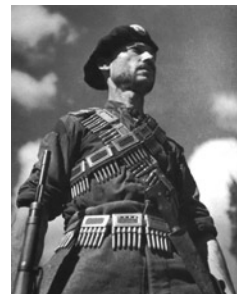
Το επιχειρησιακό σχέδιο του «Noah's Ark» προέβλεπε τον

Η οργάνωση και ο σχεδιασμός των δυο πρώτων φάσεων της επιχείρησης διήρκεσε μέχρι το χειμώνα του 1944, και ο βασικότερος στόχος των Βρετανών ήταν η παύση των εχθροπραξιών μεταξύ του ΕΛΑΣ και του ΕΔΕΣ, σύμφωνα με την πρώτη φάση της επιχείρησης. Οι προσπάθειες όμως των Βρετανών δεν ήταν επικεντρωμένες μόνο στην παύση των εχθροπραξιών, εξυπηρετώντας τις δικές τους πολιτικές και στρατιωτικές σκοπιμότητες, αλλά στη θετική συγκατάθεση του ΕΛΑΣ για την εκτέλεση της επιχείρησης. Όπως και στην περίπτωση της επιχείρησης ANIMALS, έτσι και στην επιχείρηση NOAH'S ARK η συμμετοχή των ανταρτών του ΕΛΑΣ ήταν αναγκαία προϋπόθεση για την εκτέλεσή της. Στις αρχές Ιανουαρίου του 1944 η Συμμαχική Στρατιωτική Αποστολή (ΣΣΑ) παρουσίασε τα σχέδια της επιχείρησης στους επικεφαλής του ΕΛΑΣ, ζητώντας