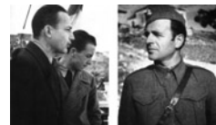
Φωτογραφίες με πορτραίτα αγωνιστών του ΕΑΜ-ΕΛΑΣ.

Η SOE στα τέλη Μαΐου του 1943, έλαβε οδηγίες να αποκόψει όλες τις κεντρικές γραμμές επικοινωνιών του εχθρού που διέσχιζαν την Ελλάδα, στο πλαίσιο της συμμαχικής απόβασης στη Σικελία, παραπλανώντας τον εχθρό και κάνοντάς τον να νομίζει ότι η απόβαση θα γίνονταν στην Ελλάδα. Η επιχείρηση, η οποία έλαβε την ονομασία ANIMALS , θα έπρεπε να εκτελεστεί μεταξύ της τελευταίας εβδομάδας του Ιουνίου και της πρώτης του Ιουλίου. Πιο συγκεκριμένα, η τελευταία φάση του σχεδίου προέβλεπε