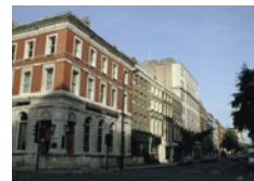
Αποψη των πρώτων κτιρίων που στέγασαν την υπηρεσία SOE,