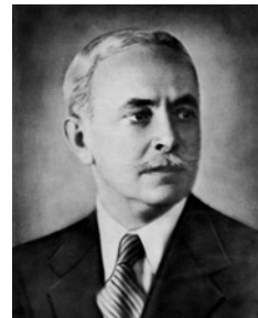
Ο διοικητής της Εθνικής Τράπεζας Ελλάδος, Αλέξανδρος Κορυζής

Η ισχυρή πίεση των γερμανικών δυνάμεων και η κάθοδός τους προς τα νότια οδήγησε τη νέα κυβέρνηση του Εμμανουήλ Τσουδερού και τον Βασιλιά στην Κρήτη. Η παραμονή τους όμως στο νησί ήταν πολύ σύντομη. Με την έναρξη της γερμανικής επίθεσης στο