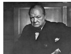
Ο Βρετανός πρωθυπουργός Γουίλσον Τσώρτσιλ θεωρούσε