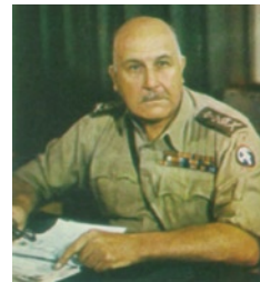
Ο Βρετανός αρχιστράτηγος Μέσης Ανατολής σερ Χένρι

Οι γερμανικές δυνάμεις όμως παρέμεναν στην Ελλάδα και από πληροφορίες των Συμμαχικών Αποστολών στην Ελλάδα δεν θα αποχωρούσαν σύντομα. Έτσι διατάχθηκε η εκτέλεση επιχειρήσεων μικρής κλίμακας, ώστε να ανυψωθεί το ηθικό και η επιχειρησιακή εμπειρία των δυνάμεων των ανταρτών και των Συμμάχων. Οι επιχειρήσεις αυτές είχαν στόχο να δημιουργήσουν πλήγματα στον εχθρό, χωρίς όμως να τον προκαλέσουν να προβεί σε εκκαθαριστικές επιχειρήσεις, και να φανερώσουν τις προθέσεις των Συμμάχων. Τον Αύγουστο άρχισαν να φαίνονται τα πρώτα δείγματα κινητικότητας του εχθρού και προετοιμασίας του για αποχώρηση. Έτσι, στις 10 Σεπτεμβρίου (10 ημέρες πριν οι Βρετανοί αποβιβαστούν στην Πελοπόννησο) δόθηκε η διαταγή σε όλες τις Συμμαχικές Αποστολές στην Ελλάδα για την εκτέλεση όλων των επιθέσεων στους στόχους που αρχικά είχαν επιλεγεί.