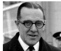
Ο σερ Γουόλτερ Μόνκτον, Βρετανός αναπληρωτής υπουργός