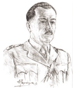
Ζωγραφική αποτύπωση σε σκίτσο του στρατιωτικού διοικητή

Η επιχείρηση εκτελέστηκε τόσο από Βρετανούς αξιωματικούς, όσο και από ομάδες ανταρτών του ΕΛΑΣ και του ΕΔΕΣ, οι οποίοι πέρα από τη συμμετοχή τους στις καταστροφές κάλυπταν τις ομάδες δολιοφθορών. Οι επιχειρήσεις, οι οποίες άρχισαν να