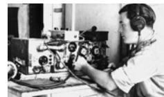
Μέχρι τα τέλη Ιουνίου του 1943, λειτουργούσαν στην

Ο αρχιστράτηγος Μέσης Ανατολής αναγνωρίζοντας την οργάνωση και τον ικανοποιητικό εφοδιασμό του αντάρτικου κινήματος στην Ελλάδα, θεώρησε ότι θα έπρεπε να ζητηθεί η συνεισφορά των ανταρτών στην ευρύτερη συμμαχική στρατηγική, και πιο συγκεκριμένα σε επιχειρήσεις παραπλάνησης των Γερμανών. Για να βοηθηθούν όμως οι αντάρτες θα έπρεπε αρχικά να επιλυθεί από τους Βρετανούς ένα μείζον πολιτικό θέμα: το ζήτημα της στάσης απέναντι στο ΕΑΜ- ΕΛΑΣ. Τόσο η SOE στο Λονδίνο, όσο και στο Κάιρο ήταν σχεδόν σίγουρες ότι ο ΕΛΑΣ ελέγχονταν από το ΚΚΕ ενώ ο Ζέρβας, αν και δημοκρατικός, ήταν προετοιμασμένος να δεχτεί τις διαταγές των Βρετανών. Το θέμα αυτό ανέφερε η SOE στην επιτροπή των αρχηγών των Επιτελείων στο Λονδίνο και το αποτέλεσμα ήταν ο ίδιος ο Τσώρτσιλ, ενεργώντας ως υπουργός Εξωτερικών να στείλει ένα τηλεγράφημα στον υπουργό Μέσης Ανατολής, στο οποίο