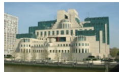
Το κτίριο της Μυστικής Υπηρεσίας Πληροφοριών (SIS), στο

Σε σχέση με τα δίκτυα που είχε αναπτύξει η SIS πριν από τον Β΄ Παγκόσμιο πόλεμο, η περιοχή που είχε ιδιαίτερα παραμεληθεί ήταν η Μέση Ανατολή, εφόσον δεν υπήρχαν οι διαθέσιμοι πόροι για να δημιουργηθεί ένα δίκτυο παρόμοιο με αυτό της Ευρώπης, επειδή χρόνο με το χρόνο ο προϋπολογισμός της υπηρεσίας μειώνονταν. Στις αρχές της δεκαετίας του '20 στην περιοχή της Μέσης Ανατολής λειτουργούσαν μόνο δυο σταθμοί,