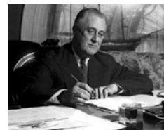
Η παρέμβαση του προέδρου των ΗΠΑ Φράνκλιν Ρούσβελτ