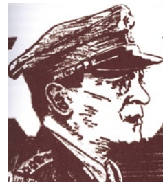
Σκισσογραφική αναπαράσταση του αντισυνταγματάρχη Γιάννη

Οι προτάσεις αυτές του αρχηγού της SOE (Καΐρου) τελικά βρήκαν ανταπόκριση και εφαρμόστηκαν. Έτσι, μετά το πέρας της επιχείρησης του Γοργοπόταμου, και έχοντας ολοκληρώσει την αποστολή της, η ομάδα HARLING ξεκίνησε για την αναχώρησή της, με υποβρύχιο από τη δυτική Ελλάδα, πέντε μίλια νότια της Πάργας. Φτάνοντας όμως η ομάδα στο σημείο που είχε οριστεί για την παραλαβή της, ο Μάιερς ενημερώθηκε ότι δεν θα έρχονταν το υποβρύχιο και ότι θα έπρεπε να γυρίσει πίσω, στη βάση του Ζέρβα. Εκεί, ο Μάιερς ενημερώθηκε για τις νέες οδηγίες της SOE, που ανέφεραν ότι θα έπρεπε ν' αναλάβει τον συντονισμό και την παραπέρα ανάπτυξη της δραστηριότητας των ανταρτών. Ο συνταγματάρχης Μάιερς προάγονταν σε ταξίαρχο - διοικητή όλων των