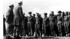
Φωτογραφικό στιγμιότυπο κατά το οποίο ο συνταγματάρχης