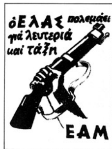
Ήδη από τον Φεβρουάριο του 1942 είχε ανακοινωθεί από το