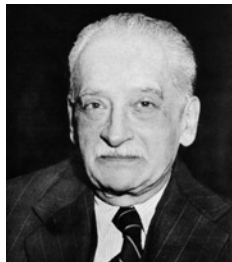
Ο Εμμανουήλ Τσουδερός πίστεψε πως η κυβέρνησή του

Στα τέλη του 1943 ο αρχιστράτηγος Μέσης Ανατολής εκτιμούσε ότι η μελλοντική στρατιωτική αξία του ΕΑΜ - ΕΛΑΣ θα ήταν μικρή και μόνο παθητική υποστήριξη θα μπορούσε να προσφέρει κι αυτό διότι η νίκη των Συμμάχων ήταν πλέον ξεκάθαρη. Τις εκτιμήσεις αυτές εκμεταλλεύτηκε ο Βρετανός πρεσβευτής στην ελληνική κυβέρνηση