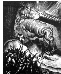
Η ανατίναξη της γέφυρας του Γοργοπόταμου, σε ξυλογραφία

Μπορεί βέβαια η ομάδα του Προμηθέα II να μην είχε τη δυνατότητα εκτέλεσης δολιοφθορών, διότι δεν διέθετε τα αναγκαία μέσα, παρέμενε όμως ο βασικότερος αξιόπιστος συνεργάτης και κανάλι επικοινωνίας της ΣΟΕ. Αυτή η εμπιστοσύνη οδήγησε το στρατηγείο Μέσης Ανατολής και την ΣΟΕ να αναθέσουν στην ομάδα του Προμηθέα II τον συντονισμό μιας από τις σημαντικότερες επιχειρήσεις: τη δολιοφθορά τριών κομβικών σημείων της σιδηροδρομικής γραμμής Θεσσαλονίκης - Αθηνών. Στις 5 Σεπτεμβρίου του 1942 η ΣΟΕ μετέδωσε στην ομάδα του Προμηθέα II μήνυμα του αρχιστράτηγου Μέσης Ανατολής, ο οποίος αναφέρονταν στη σπουδαιότητα ενός πλήγματος στη σιδηροδρομική γραμμή Θεσσαλονίκης - Αθηνών. Ο αρχιστράτηγος ζητούσε από τον Προμηθέα II να αναφέρει κατά πόσο οι αντάρτες είχαν τη δυνατότητα να ανατινάξουν τη γέφυρα της Παπαδιάς, με δεδομένο ότι θα εφοδιάζονταν με τα αναγκαία εκρηκτικά, χρήματα, κ.ά. Δύο ημέρες αργότερα ο Προμηθέας II απάντησε στην Σ.Ο.Ε. ότι δέχονται να εκτελέσουν το εγχείρημα και ξεκίνησαν τις προετοιμασίες. Για να κάνει το εγχείρημα αυτό πιο αποτελεσματικό αλλά και πιο εύκολο για τους αντάρτες η ΣΟΕ πρότεινε, πέρα από τη γέφυρα της Παπαδιάς, άλλες δυο γέφυρες, του Γοργοπόταμου και του Ασωπού, όπως επίσης την αποστολή έμπειρων αξιωματικών του μηχανικού. Η κατάσταση όμως στη Βόρεια Αφρική, άρχισε να γίνεται πιο πιεστική. Ο αρχιστράτηγος Μέσης Ανατολής