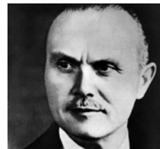
Μετά την παραίτηση των υπουργών της κυβέρνησης