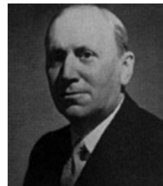
Ο Βρετανός πρεσβευτής στην ελληνική κυβέρνηση Ρέτζιναλτ

Την ίδια περίοδο, το ΕΑΜ πρότεινε και αυτό στην κυβέρνηση Τσουδερού τον σχηματισμό κυβέρνησης Εθνικής Ενότητας. Ο Τσουδερός τόνισε ότι η συνεργασία προαπαιτούσε την παύση των εχθροπραξιών μεταξύ του ΕΛΑΣ και των υπόλοιπων οργανώσεων. Ακολούθησε η διάσκεψη της Πλάκας, όπου συμφωνήθηκε η οριστική παύση των συγκρούσεων και έτσι ξεκίνησε η διαδικασία σχηματισμού ενιαίας κυβέρνησης, αφού πρώτα μεσολαβήσουν και άλλες εξαιρετικά σημαντικές εξελίξεις, μέχρι το συνέδριο του Λιβάνου τον Μάιο. Τον Ιανουάριο και Φεβρουάριο του 1944, σε επιστολές τους προς τον Τσουδερό, ο Σοφούλης, ο Γονατάς και άλλοι πολιτικοί παράγοντες θα κατηγορήσουν το ΕΑΜ ότι προσέβλεπε σε δικτατορία του ΚΚΕ, θα αντιταχθούν στη συνεργασία μαζί του, ενώ θα