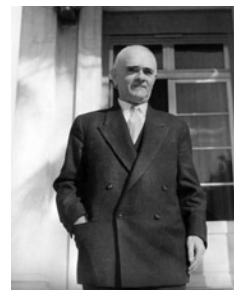
Ο συνταγματάρχης Κωνσταντίνος Δόβας, διευθυντής του τμή-

Ο Κανελλόπουλος θεωρούσε ότι το κέντρο συντονισμού του αντιστασιακού αγώνα στην Ελλάδα θα μπορούσε να υλοποιηθεί δια μέσου του συνεργάτη του Ε. Τσέλλου, ο οποίος δεν ήταν μόνο πρόσωπο απόλυτης εμπιστοσύνης, αλλά είχε και άμεση συνεργασία με μια οργάνωση αποτελούμενη από έξι συνταγματάρχες, που θα μπορούσε να φέρει σε πέρας αυτό το εγχείρημα. Η οργάνωση ονομαζόταν ΘΕΡΟΣ και την αποτελούσαν ο Παναγιώτης Σπηλιωτόπουλος, ο Στυλιανός Κιτριλάκης, ο Θρασύβουλος Τσακαλώτος, ο Ευστ. Λιώσης, ο Αγ. Φιλιππίδης και ο Κωνσταντίνος Δόβας. Ο Κανελλόπουλος επιθυμούσε για τον Τσιγάντε να χρησιμεύσει ως σύνδεσμος με τον Τσέλλο και με άλλα πρόσωπα στην Αθήνα για τον συντονισμό του αγώνα εκεί, συγκεκριμένα για την ίδρυση ενός υπερκομματικού «Κέντρου Συντονισμού». Ο Τσιγάντες με την άφιξή του στην Ελλάδα ξεκίνησε αμέσως επαφές σχεδόν με όλες τις πολιτικές παρατάξεις και ομάδες, όπως επίσης και με τις διάφορες αντιστασιακές οργανώσεις, για την επίτευξη μιας βάσης συνεργασίας. Κάθε όμως προσπάθεια συνεργασίας αποδεικνύονταν αδύνατη. Το αποτέλεσμα ήταν να αποκαλυφθεί το κρησφύγετό του από προδοσία και τελικά να σκοτωθεί σε συμπλοκή με Ιταλούς στις 14 Ιανουαρίου του 1943.