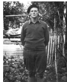
Ο Κρις Γούντχαους, αρχηγός της Στρατιωτικής Συμμαχικής

Στο σημείο αυτό θα πρέπει να σημειωθεί ότι η στάση του Μάιερς και του Γούντχαους σε σχέση με το ΕΑΜ-ΕΛΑΣ και τον ΕΔΕΣ αποτελούν στοιχεία φανερών παρεμβάσεων στα εσωτερικά των οργανώσεων. Σε τελευταία ανάλυση οι δύο αυτοί αξιωματούχοι που είχαν εμπισθεί τη διαχείριση της πολύπλοκης ελληνικής πολιτικής πραγματικότητας δεν ήταν παρά δύο νεαρά άτομα που δεν διέθεταν καμία προηγούμενη πολιτική εμπειρία. Η εγκατάσταση της ομάδας HARLING στο αρχηγείο του ΕΔΕΣ αποδείχτηκε καθοριστική για τη σύνδεση του Μάιερς και του Γούντχαους με το πρόσωπο του Ζέρβα. Η ενημέρωση των αρχηγών της ΒΣΑ για το ΕΑΜ - ΕΛΑΣ προέρχονταν από τον ίδιο το Ζέρβα, αφού κανένας αξιωματούχος της SOE δεν φρόντισε να ενημερώσει την ομάδα HARLING πριν αναχωρήσει για την Ελλάδα. Η στάση που διαμόρφωσαν απέναντι στο ΕΑΜ - ΕΛΑΣ ήταν άκρως αρνητική, εφόσον είχαν επιλέξει να υποστηρίζουν τον Ζέρβα.