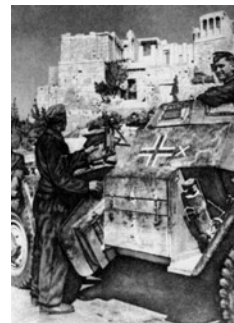
Μεγάλη ανησυχία είχε προξενήσει στους Βρετανούς η στάση