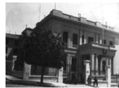
Άποψη του κτιρίου της Αγγλικής πρεσβείας στην κατοικική

Ο Γούντχαους, έπρεπε να αντιμετωπίσει αυτό το πρόβλημα, ειδικότερα τη στιγμή εκείνη, που είχε επιτευχθεί η κατάπαυση των εχθροπραξιών μεταξύ ΕΛΑΣ και ΕΔΕΣ. Το πρωτόκολλο όμως της συμφωνίας της Πλάκας περιείχε και έναν μυστικό όρο, σύμφωνα με τον οποίο «Αι Οργανώσεις ΕΑΜ / ΕΛΑΣ, ΕΔΕΣ, ΕΚΚΑ θα εξακολουθήσουν να παρέ-