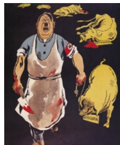
Αφίσα για τη βαλκανική πολιτική του Χίτλερ.