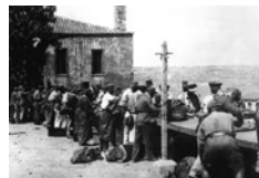
Αποχώρηση Γερμανών από το λιμάνι της Σούδας.

Ύστερα από τρεισήμισι χρόνια η Ελλάδα απελευθερώθηκε από έναν σκληρό στρατιωτικό ζυγό, έχοντας υποστεί τεράστιες καταστροφές. Η οικονομία της είχε εξαρθρωθεί, οι απώλειες όμως στο ανθρώπινο δυναμικό της ήταν αυτές που είχαν πληγώσει ανεπανόρθωτα τη χώρα: κατά τη διάρκεια των ετών αυτών Γερμανοί, Βούλγαροι και Ιταλοί είχαν μεταχειριστεί κάθε μέσο με σκοπό να υποτάξουν το αγωνιστικό φρόνημα του λαού και να αφαιρέσουν από τον κορμό του έθνους τους συνεκτικούς αρμούς του. Παρά τους χιλιάδες εκτελεσμένους, την ερήμωση της υπαίθρου, τα εκατοντάδες καταστραμμένα χωριά, την πείνα, την εξαθλίωση, τις συλλήψεις και τα βασανιστήρια, την καταρράκωση της αξίας της ανθρώπινης ζωής, της τιμής και του δικαιώματος της παρουσίας, ο ελληνικός λαός παρέμεινε πιστός στη συμμαχική υπόθεση και αγωνίστηκε με σθένος για την ελευθερία του αλλά και για την ελευθερία όλων εκείνων των ανθρώπων που μέχρι τότε υπέφεραν εξαιτίας των ρατσιστικών αντιλήψεων και του ολοκληρωτισμού, υπό το πέλαμα του φασισμού και του αγκυλωτού σταυρού. Η τελική δικαίωση του αγώνα ήρθε τη στιγμή της απελευθέρωσης, το τίμημα ωστόσο για τη συνοχή της χώρας έμελλε να πληρωθεί ακριβότερα σε ένα αμέσως επόμενο στάδιο.