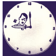
Αφισέττα που κυκλοφόρησε το 1944 και σχολιάζει την επικει-

«Ημείς οι Έλληνες, οι οποίοι μετά των εντίμων και ανδρείων Γερμανών στρατιωτών αγωνιζόμεθα εντός του εδάφους της αιωνίας ημών πατρίδος υπέρ των αιώνιων ιδεωδών του Ευρωπαϊκού πολιτισμού, της θρησκείας, της οικογένειας και της πατρίδος υμνούμεν και δοξάζομεν τον προστάτην υμών και φιλεύσπλαχτον Θεόν, ο οποίος έσωσεν υμάς τον μέγαν Φύρερ της Γερμανίας και ολοκλήρου της Ευρώπης από τους όνυχας των κακών και πονηρών δαιμονίων οι οποίοι ηθέλησαν να Σας δολοφονήσουν. Επ' ευκαιρία της διασώσεώς Σας εκφράζομεν προς Υμάς τα αδερφικά φιλικά αισθήματα και δεόμεθα του παντοδυνάμου Θεού να χαρίση εις Υμάς ζωήν και ικανότητα προς δράσιν δια να αγωνισθήτε υπέρ της Ευρώπης εναντίον των ατιμών Εβραίοπλουτοκρατών και των απαισίων πρακτόρων της Μόσχας, εναντίον των κοινών αυτών δολοφόνων και εκθρών της πραγματικής ελευθερίας και της ευημερίας του εργαζόμενου και τιμού λαού ολοκλήρου της ανθρωπότητας».