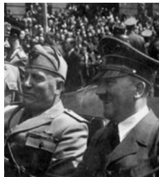
Ο Χίτλερ και ο Μουσολίνι.

Η Γερμανία παρέπεμψε, σοφά ποιούμενη, για το τέλος του πολέμου την εξέταση των απαιτήσεων των συμμάχων της για την προσάρτηση τμημάτων της ελληνικής επικράτειας. Επί του παρόντος, ο Χίτλερ θεώρησε ότι ήταν αρκετά βαρύ φορτίο για τους Έλληνες ο τριπλός διαμελισμός της χώρας τους και δεν επιθυμούσε να προσθέσει σε αυτό το φορτίο ακόμη ειδικθότερους όρους που παρέπεμπαν σε έναν οριστικό εδαφικό ακρωτηριασμό της. Αν και οι Γερμανοί κράτησαν για τον εαυτό τους στρατιωτικής σημασίας περιοχές, όπως ήταν η Θεσσαλονίκη και η ενδοχώρα της, ωστόσο η παρουσία τους στην Ελλάδα θα έπρεπε αυτό το πρώτο διάστημα να ακολουθεί τις παραπάνω δεσμευτικές παραμέτρους, ιδίως απέναντι στους Ιταλούς, αποφεύγοντας την ενεργή ανάμειξη σε ζητήματα διοίκησης και ασφάλειας. Άλλωστε, ο Χίτλερ ήταν σαφής όταν έλεγε ότι η στάση της Γερμανίας στις εξελίξεις θα έπρεπε να ήταν αυτή ενός ενδιαφερόμενου και μόνο θεατή. Τα μετέπειτα γεγονότα δε δικαίωσαν ούτε τα γερμανικά αρχικά σχέδια και πολύ περισσότερο τα λόγια του Χίτλερ.