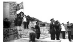
Ναζιστική τελετή στην Κρήτη.

Αν όμως η αντιμετώπιση της αντίστασης διά της επιβολής αντιποίνων δεν είχε επιφέρει τα επιθυμητά αποτελέσματα για τις γερμανικές Αρχές, το ίδιο δεν είχε συμβεί στο επίπεδο εκφοράς ενός προπαγανδιστικού δικαστικού λόγου χάρη και στον οποίο η πολιτική και το ελληνικό πολιτειακό ζήτημα έτειναν να καλύψουν τον στρατιωτικό αγώνα εναντίον του κατακτητή. Με άλλα λόγια, οι εσωτερικές διαμάχες μεταξύ των αντιστασιακών οργανώσεων και οι ιδεολογικές πολώσεις εντός της ελληνικής κοινωνίας,