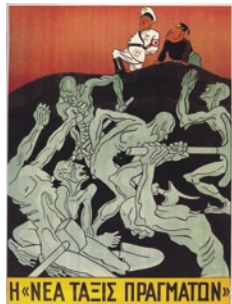
Αφίσα που εικονίζει τη «Νέα Τάξη» της χιτλερικής Γερμανίας.

Η γερμανική επιδρομή στις πλουτοπαραγωγικές πηγές της χώρας συνδυάστηκε με μια