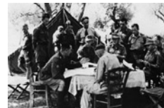
Συμβούλιο Γερμανών στρατιωτικών κατά τη διάρκεια επιχειρήσεων

Μεταξύ των Γερμανών στρατιωτικών υπήρχε μια γενικότερη ομοφωνία που συνίστατο στην ανάγκη να εφαρμοστεί μία επιθετικότερη πολιτική για την επίλυση του προβλήματος των ανταρτών, ακόμα και στην περίπτωση που αυτή η πολιτική θα προκαλούσε απώλειες μεταξύ των αμάχων. Σε αντίθεση με τη γερμανική άποψη σχετικά με την εφαρμογή σκληρών μέτρων για την καταπολέμηση των ανταρτών, η ιταλική πλευρά δεν επέδειξε την ίδια αποφασιστικότητα και γενικά η στάση της ήταν σαφώς διαφοροποιημένη σε σχέση με τον χαρακτήρα των αντιποίνων που είχαν υιοθετήσει οι σύμμαχοί τους. Ενδεικτικές αυτής της διαφοροποίησης ήταν οι πιέσεις που ασκήθηκαν από τους Γερμανούς, σε στρατιωτικό και πολιτικό επίπεδο, ώστε η ιταλική πλευρά να ευθυγραμμιστεί με τη γερμανική πολιτική των αντιποίνων. Από τις επαφές που είχαν οι δύο πλευρές, την άνοιξη του 1943, διαφάνηκε ξεκάθαρα η γερμανική επιδίωξη