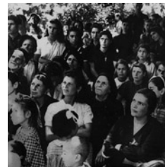
Συγκέντρωση πληθυσμού στα πλαίσια της γερμανικής προπα-

Όσο πολώνονταν οι συνθήκες και πλήθαιναν οι συγκρούσεις μεταξύ των Ταγμάτων Ασφαλείας και του ΕΛΑΣ, τόσο περισσότερο οι συγκρούσεις αυτές πλησίαζαν στις παρυφές ενός εμφυλίου πολέμου. Η προοπτική ενός γενικευμένου εμφυλίου πολέμου έστρεψε ολοένα και περισσότερο το «ελληνικό ενδιαφέρον» στον εσωτερικό εχθρό, καθώς οι επιθέσεις και οι δολοφονίες που διέπραττε η μια πλευρά ξεπληρώνονταν με το «ίδιο νόμισμα» από την άλλη. Για τον σκοπό αυτό οι Γερμανοί χρησιμοποίησαν ευρέως τους άντρες των Ταγμάτων Ασφαλείας σε επιχειρήσεις αντιποίνων κατά αμάχων και στελεχών ή υποστηρικτών του ΕΑΜ και των οικογενειών τους, στρέφοντας κατά των συνεργατών τους την οργή του λαού. Σε σχετική οδηγία της η Ομάδα Στρατού Ε (Heeresgruppe E), που έδρευε στο Πανόραμα (Αρσακλί) της Θεσσαλονίκης, είχε περιγράψει τη δεξαμενή από την οποία θα αντλούσαν εθελοντές για τον γερμανικό στρατό: «Ο εξοπλισμός και τα πολεμοφόδια προέρχονται από τις σχετικές ποσότητες που έχουν λαφυραγωγηθεί από τις συμμορίες. Η επιλογή των αντρών των μονάδων αυτών από τους ανθρώπους εμπιστοσύνης δεν επαρκεί. Τα τμήματα αυτά θα πρέπει