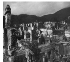
Το Καρπενίσι μετά την πυρπόλησή του από γερμανικές

Σε γενικές γραμμές, πολλοί Γερμανοί ανώτεροι αξιωματικοί ήταν πεπεισμένοι ότι ο τρόπος που είχε επιλεγεί για να αντιμετωπιστεί ο ανταρτικός κίνδυνος δεν οδηγούσε