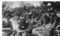
Τμήμα της γερμανικής 117 Μεραρχίας πεζικού αναπαύεται

Όπως αποδείχθηκε δεν ήταν αρκετή ούτε και η πρωτοβουλία που ανέλαβε ο Νώμπαχερ, ο οποίος βρέθηκε, ύστερα από διαταγή του Χίτλερ, στην Ελλάδα και στις άλλες κατεχόμενες χώρες της Χερσονήσου του Αίμου. Στόχος του Γερμανού εντεταλμένου του Υπουργείου Εξωτερικών ήταν να συμπτύξει ένα αντικομμουνιστικό μέτωπο,