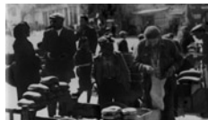
Η μαύρη αγορά αποτέλεσε συνήθη πρακτική εξεύρεσης

Ο ανταγωνισμός μεταξύ των Γερμανών και των Ιταλών για το προβάδισμα στον έλεγχο και την εκμετάλλευση των δυνατοτήτων της ελληνικής οικονομίας δεν ήταν το μοναδικό πεδίο σύγκρουσης που απειλούσε τις σχέσεις μεταξύ των δύο συμμάχων. Η συνεργασία και γενικά η συμμαχία δοκιμάστηκε σε πολλά ζητήματα μέσα στα δύο χρόνια της κοινής τους παρουσίας στην Ελλάδα (Απρίλιος 1941-Σεπτέμβριος 1943), καταδεικνύοντας πολλαπλώς ότι μόνο αγαστή δεν ήταν και ότι πίσω από τις τυπικές συμφωνίες για τα θέματα διοίκησης και κατοχής υπήρχε μια διαφορετική αντίληψη για τον τρόπο προσέγγισης και κυρίως για τους προσφορότερους τρόπους αντιμετώπισης μιας σειράς προβλημάτων που επρόκειτο πολύ γρήγορα να αναδυθούν στην επιφάνεια. Αν στην περίπτωση των ελληνικών επιχειρήσεων και των εγκαταστάσεων Βιομηχανικού ενδιαφέροντος υπήρξαν τελικά κοινά σημεία επαφών και η θέληση για κινησεις καλής θέλησης από γερμανικής πλευράς, με σκοπό την άρση των παρεξηγήσεων μέσω μιας δικαιότερης διανομής των κομματιών της «πίτας», ενώπιον των κρίσιμων ζητημάτων οι διαφορετικές προσεγγίσεις έδειχναν και τις διαφορετικές πολιτικές, με άλλα λόγια την αδυναμία χάραξης μιας κοινής κατοχικής πολιτικής. Ο τρόπος με τον οποίο Ιταλοί και Γερμανοί χειρίστηκαν τα ζητήματα αυτά ήταν αποτέλεσμα μιας γενικότερης διαφοροποίησης που εμφανώς υφίστατο μεταξύ Ρώμης και Βερολίνου αναφορικά με την ιδεολογία του πολέμου και κατ' επέκταση με την ιδεολογία και την κοσμοθεωρία