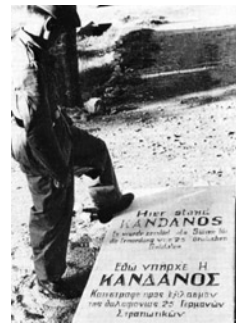
Γερμανός στρατιώτης πάνω από την αναμνηστική επιγραφή που