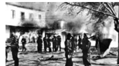
Στιγμιότυπο από την καταστροφή του Διστόμου (Αρχειο)

Ανάμεσα στα αναρίθμητα περιστατικά μαζικών αντιποίνων και ειδικών πράξεων σε βάρος των αμάχων της περιόδου 1943-1944 θα μπορούσε κανείς να ξεχωρίσει τις περιπτώσεις των πυρπολήσεων των κωμοπόλεων των Καλαβρύτων, του Διστόμου και της Κλεισούρας. Στις 13 Δεκεμβρίου 1943 μονάδες του τακτικού γερμανικού στρατού έκαψαν σε αντίποινα τα Καλάβρυτα, ενώ την ίδια τύχη είχαν γειτονικά χωριά και οι ιστορικές μονές της Αγίας Αούρας και του Μεγάλου Σπηλαίου. Μέσα σε μια εβδομάδα εκτελέστηκαν περίπου 695