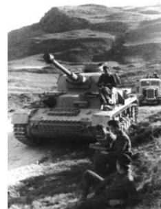
Γερμανικά μηχανοκίνητα οχήματα αναζητούν αντάρτες.

Παρά τις όποιες αλλαγές που πράγματι επέφερε η διαταγή του Δεκεμβρίου του 1943, άφηνε ταυτόχρονα πολλά περιθώρια για αυθαιρεσίες από την πλευρά των γερμανικών τμημάτων. Η διατήρηση όσων ίσχυαν μέχρι τότε, σε σχέση κυρίως με την παγιωμένη συμπεριφορά της Βέρμαχτ σε συνθήκες μάχης, οφειλόταν στον τρόπο με τον οποίο η Βέρμαχτ αντιλαμβανόταν τη μάχη, όταν είχε να αντιμετωπίσει έναν εν εξελίξει ανταρτοπόλεμο, καθώς και στα κριτήρια με βάση τα οποία διέκρινε τους εχθρούς από τον άμαχο πληθυσμό. Από την άλλη πλευρά, η απαγόρευση της εφαρμογής των μέτρων εξιλασμού κατά όμορων, με το οποίο συμβάν, κοινοτήτων, με στόχο να αποκατασταθεί το κύρος και το πνεύμα δικαίου του γερμανικού στρατού, οδήγησε στην απόφαση για τη σύλληψη αθώων, αλλά για τις γερμανικές Αρχές συνυπεύθυνων, καθώς αναγνωρίζονταν ως κομμουνιστές. Επιπλέον, η διαταγή παρείχε στους στρατιώτες το δικαίωμα να εκτελούν γυναίκες και παιδιά, μόνο στην περίπτωση που θα θεωρούνταν δράστες ή βοηθοί των ανταρτών. Αναφορικά όμως με τις δύο αυτές περιπτώσεις, η εγγενής αδυναμία να αναγνωρίσει κανείς στο πρόσωπο του άλλου τα αδιάκριτα χαρακτηριστικά γνωρίσματα του κομμουνιστή ή να κατατάξει στην κατηγορία των ενόχων ή των αθώων γυναίκες και