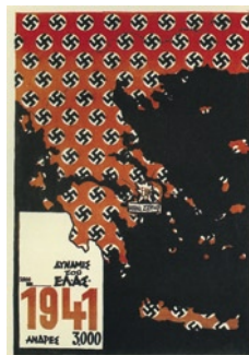
Αφίσα του ΕΛΑΣ για τη γερμανική κατοχή στην Ελλάδα του

Κατά τη διάρκεια των εκθροπραξιών κατά μήκος της γραμμής Μεταξά, στα ελληνοβουλγαρικά σύνορα τον Απρίλιο του 1941, η Βέρμαχτ προσπάθησε να διασπάσει εκ των έσω τη θέληση αντίστασης των Ελλήνων στρατιωτών και τη συνοχή του αντίπαλου στρατού, ρίχνοντας χιλιάδες προπαγανδιστικά φυλλάδια στα οποία «εξηγούσε» τους λόγους της επίθεσης εναντίον της Ελλάδας. Τα φυλλάδια αυτά εγκαινίασαν από τη στιγμή εκείνη την «επίθεση φιλίας» που εξαπέλυσαν οι Γερμανοί, ταυτόχρονα με τις στρατιωτικές επιχειρήσεις, με σκοπό να κερδίσουν συναισθηματικά και ηθικά τους αντιπάλους τους και να αποκαταστήσουν το τρωθέν, λόγω της επίθεσης, γόπτρο της Γερμανίας στην Ελλάδα. Οι ιστορικές αναγωγές που επιχειρήθηκαν σε πολλά τέτοια προπαγανδιστικά κείμενα, που ρίφθηκαν στις ελληνικές γραμμές, αποκάλυπταν τις γερμανικές απόψεις για τους λόγους διεξαγωγής της επιχειρήσεως αυτής, ενώ ταυτόχρονα άφηναν «υποσχέσεις» για το είδος της πολιτικής που θα εφαρμοζόταν έναντι των ηττημένων μετά την κατάληψη της χώρας.