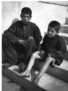
Το πρόβλημα της πείνας αποτέλούσε μία μόνο πτυχή των