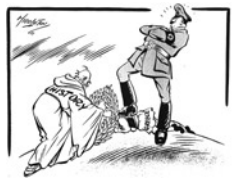
Αγγλική γελοιογραφία που εικονίζει τον Χίτλερ να πατά την

Όταν η δύναμις της Αγγλίας θα είναι αφανισμένη, τότε και Σεις θα είσθε ένας ελεύθερος, ευτυχής λαός εις μίαν ελευθέραν, ευτυχί Ευρώπην».