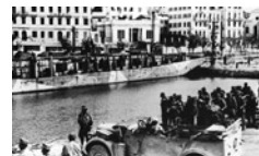
Γερμανικά στρατεύματα στην Κέρκυρα μετά τη συνθηκολό-

Στις 9 Δεκεμβρίου 1943, ο «επιτελάρχης του στρατιωτικού διοικητή νοτιοανατολι-