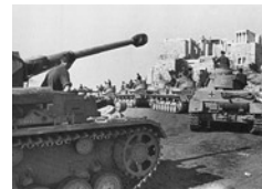
Γερμανικά τανκς στην Ακρόπολη.

Στη δραματική επιδείνωση της επισιτιστικής κατάστασης συνετέλεσε αναμφίβολα και η αδυναμία του κράτους να ελέγξει την παραγωγή και να επιβάλει στους παραγωγούς την εφαρμογή των νόμων για την παράδοση των προϊόντων. Όταν άρχισαν να ανεβαίνουν οι τιμές και να καλπάζει ο πληθωρισμός, οι τελευταίοι ήταν σε θέση να πουλήσουν την παραγωγή τους σε καλύτερες τιμές ή να τη διοχετεύσουν στη διαδεδομένη μαύρη αγορά, κερδίζοντας ασφαλώς πολύ περισσότερα από τις καθορισμένες τιμές του κράτους. Έτσι, η μαύρη αγορά έγινε, με την εξάρθρωση των κρατικών μηχανισμών ελέγχου, την αποτυχία συλλογής της παραγωγής και της κεντρικής διαχείρισής της, την αδιαφορία των Αρχών Κατοχής για την πείνα και τους θανάτους, η σημαντικότερη πηγή