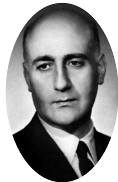
Ο λογοτέχνης Γιώργος Θεοτοκάς κατέγραψε στο ημερολόγιό

Για τους Έλληνες οι πρώτες εκτελέσεις αμάχων στην Κρήτη και η λεηλασία του εθνικού πλούτου αντικατέστησαν στη συλλογική συνείδηση τον θολό μέχρι τότε θαυμασμό για τη Γερμανία με την απογοήτευση, την απέχθεια και τελικά το μίσος για τους ενοκώψαντες «βαρβάρους». Ο λογοτέχνης Γιώργος Θεοτοκάς κατέγραψε με αξιοσημείωτη γλαφυρότητα και μεστότητα στο ημερολόγιό του, από τις πρώτες ημέρες της Κατοχής,