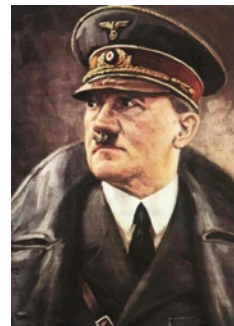
Ο Αδόλφος Χίτλερ.

Το ότι η σύμμαχος μας Ιταλία αποκτά επιρροήν επί του τόσοον εδαφικώς όσον και πολιτικώς, μόνον εις αυτήν αρμόζοντα ζωτικών χώρον, αποτελεί ικανοποίησιν ανταξίαν της μεγάλης θυσίας αίματος εις την οποία υπεβλήθη χάριν του μέλλοντος του Άξονος από του Οκτωβρίου παρελθόντος έτους και εντεύθεν».