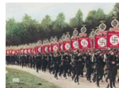
Παρέλαση γερμανικού στρατιωτικού σώματος (Ιστορικό Μου-