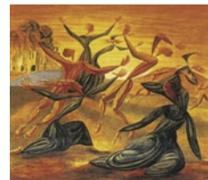
Ελαιογραφία του Leopold Survage με τίτλο «Slaying»

Το ίδιο κόστος εικάζεται πως ήταν έτοιμος να αποδεχθεί και ο ΕΛΑΣ στην προσπάθειά του να υπερισχύσει όχι τόσο στο στρατιωτικό πεδίο σε βάρος των Γερμανών, όσο κυρίως στο πολιτικό σε βάρος των εσωτερικών του αντιπάλων. Στο πλαίσιο αυτό φαίνεται πως ο ΕΛΑΣ χρησιμοποίησε από την πλευρά του τη δυσαρέσκεια που είχε αναπτυχθεί σε ένα μεγάλο τμήμα του πληθυσμού από τον άδικο χαρακτήρα των γερμανικών μέτρων, προσδοκώντας σε πολιτικά οφέλη. Σχετικά, λίγες μόνο ημέρες μετά την καταστροφή των Καλαβρύτων, το Γ' Επιτελικό Γραφείο του γερμανικού Φρουραρχείου Κορίνθου σημείωνε σε αναφορά του: «[...] Η δράση των ανταρτών παρουσιάζεται ακόμα εντονότερη και έχει προσλάβει σοβαρότερη μορφή. Η κατάσταση, σύμφωνα με την οποία από τη στιγμή της επιβολής των μέτρων εξιλασμού δεν μειώθηκε σε καμία περίπτωση ο αριθμός των επιθέσεων και των δολιοφθορών, αντίθετα πολλαπλασιάστηκε, αποκαλύπτει με βεβαιότητα τους ακολουθούμενους με συνέπεια από το ΕΑΜ σκοπούς του. Μέσα από τις επιθέσεις εναντίον Γερμανών στρατιωτών και τις προκα-