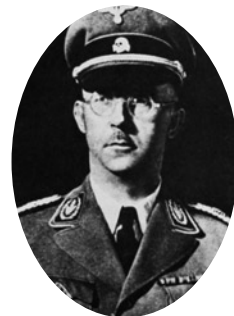
Ο Χάινριχ Χίμλερ, αρχηγός των SS και της Γκεστάπο.