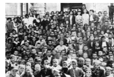
Όρφανά των εκτελεσθέντων στα Καλάβρυτα.