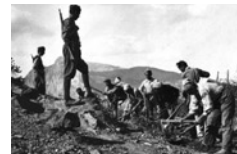
Γερμανοί αιχμάλωτοι στην Πελοπόννησο.

Φυσικά, επρόκειτο για μία πλασματική εικόνα, δημιουργοί της οποίας υπήρξαν οι ίδιοι