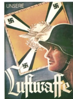
Προπαγανδιστική αφίσα της γερμανικής αεροπορίας.