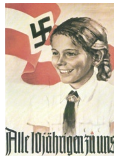
Αφίσα του εθνικοσοσιαλιστικού κόμματος της Γερμανίας.

Μετά το τέλος της μάχης της Κρήτης και της κατάληψης του νησιού, οι γερμανικές δυνάμεις προέβησαν σε εκτεταμένα αντίποινα, τα πρώτα στην κατεχόμενη Ελλάδα, που οδήγησαν στη μερική ή ολική καταστροφή πολλών χωριών στις επαρχίες Κυδωνιάς και Σελίνου του νομού Χανίων, ανάμεσά τους η Κάντανος, ο Σχοινές, ο Κυρτομάδος, ο Γαλατάς, τα Περιβόλια, το Κοντομαρί, καθώς και στην ομαδική εκτέλεση εκατοντάδων κατοίκων τους. Τα αντίποινα αυτά, σύμφωνα με τη διατυπωθείσα γερμανική άποψη, αποτελούσαν απάντηση στην παράβαση των κανόνων διεξαγωγής του πολέμου, με τη συμμετοχή και αμάχων, πολλοί από τους οποίους θεωρήθηκαν υπεύθυνοι για τη