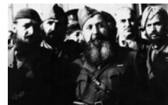
Ο αρχηγός του ΕΔΕΣ, Ναπολέων Ζέρβας, ανάμεσα σε επιτελείς

Οι πρώτες σφοδρές συγκρούσεις εντός του 1943 μεταξύ της σημαντικότερης αντιστασιακής οργάνωσης του ΕΛΑΣ και του συγκριτικά ασθενέστερου στρατιωτικά και