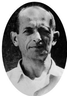
Ο Αδόλφος Άχμαν.