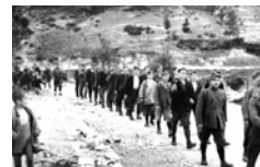
Αντάρτες σε πορεία.

Η λήψη σκληρών μέτρων, η οποία σύμφωνα με τον στρατάρχη Βίλχελμ Κάιτελ (Wilhelm Keitel) είχε οδηγήσει και στο παρελθόν σε επιτυχή αποτελέσματα στην προσπάθεια