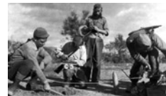
Αντάρτικη ομάδα σαμποτέρ.

Η Αντίσταση και η δυναμική που ανέπτυξε με τον πολλαπλασιασμό των ανταρτικών τμημάτων και την υποστήριξη από την πλειοψηφία του ελληνικού πληθυσμού, έτεινε σταδιακά να αφαιρέσει από τις κατοκικές δυνάμεις το συγκριτικό πλεονέκτημα της υπεροχής και κυρίως να τις οδηγήσει στην απώλεια της άσκησης ουσιαστικού ελέγχου σε ολόενα και περισσότερες περιοχές της χώρας. Το πιο ανησυχητικό όμως για τους Γερμανούς ήταν το γεγονός ότι το κλίμα τρομοκρατίας, οι πυρπολήσεις εκατοντάδων χωριών, οι μαζικές εκτελέσεις αμάχων και η ερήμωση της κατεξοχόν ανταρτοτρόφας υπαίθρου δεν έδειχναν να πτοούν την αντίπαλη πλευρά και κυρίως να την καταπονούν