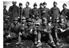
Αντάρτικη ομάδα στην Ήπειρο.

Φαίνεται όμως πως οι γερμανικές Αρχές είχαν πετύχει μία πραγματική νίκη, τιμωρώντας αμείλικτα τους κατοίκους για επιθέσεις που είχαν σημειωθεί κοντά στα χωριά τους. Αντιμετωπίζοντας την ορατή απειλή επιβολής των ίδιων ποινών, πολλά πεδινά