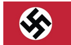
Η σημαία της ναζιστικής Γερμανίας με τη σβάστικα.

Κατά τη διάρκεια του καλοκαιριού του 1944 οι Γερμανοί πραγματοποίησαν τις τελευταίες μεγάλης κλίμακας εκκαθαριστικές επιχειρήσεις στα βουνά με αποκλειστικό σκοπό να κρατήσουν ανοικτές τις οδούς διαφυγής από το ελληνικό έδαφος και τους αντάρτες μακριά από αυτές. Η μεγάλη κινητικότητα που ήταν εμφανής το διάστημα αυτό στους