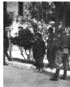
Χαρακτηριστική σκηνή από τα αμείλικτα μέτρα των Γερμανών