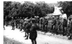
Γερμανικές δυνάμεις Κατοχής σε χωριό της ελληνικής υψίθρου.

Η αντιμετώπιση της αντίστασης σε μία κατεχόμενη χώρα, όπως ήταν η Ελλάδα, με τη χρησιμοποίηση του άμαχου πληθυσμού ως εξιλαστήριου θύματος, δεν αποτελούσε μία νέα στρατιωτική τακτική στο πλαίσιο ενός διεξαγόμενου πολέμου. Εκείνο που στην πραγματικότητα αποτελούσε «καινοτομία» από την πλευρά των στρατευμάτων του Γ΄ Ράιχ, κατά τη διάρκεια του Β΄ Παγκοσμίου πολέμου, ήταν η συχνότητα με την οποία οι στρατιώτες της Βέρμαχτ προσέφευγαν σε αντίποινα για να αντιμετωπίσουν την αναδυόμενη αντίσταση στις κατεχόμενες χώρες της Ευρώπης. Με άλλα λόγια, τα αντίποινα συνιστούσαν για την ηγεσία του Γ΄ Ράιχ αναπόσπαστο κομμάτι μιας στρατιωτικής τακτικής, δομημένης πάνω σε πρακτικές και λογικές που απέρρεαν από το καθεστώς του Εθνικοσοσιαλισμού και η οποία θεωρούσε τους αμάχους δυνάμει εχθρούς και συνεχή απειλή για τους στρατιώτες. Μάλιστα οι σχετικές αποφάσεις ελήφθησαν από την ίδια την ανώτατη ηγεσία και κοινοποιήθηκαν με διαταγές προς τους τοπικούς στρατιωτικούς διοικητές. Έτσι, για πρώτη φορά στην μέχρι τότε ιστορία των πολεμικών συρράξεων, η προσφυγή σε αντίποινα είχε την επίσημη αποδοχή και κάλυψη της ηγεσίας του στρατού που, στην περίπτωση της Εθνικοσοσιαλιστικής Γερμανίας, αποφάσιζε και για