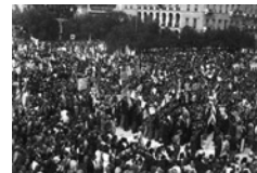
Σκηνή από την απελευθέρωση της Αθήνας τον Οκτώβριο του

Μετά την απελευθέρωση του μεγαλύτερου μέρους της ηπειρωτικής χώρας και των νησιών, εξαιρουμένων ορισμένων νησιών όπου εγκλωβίστηκαν γερμανικά και ιταλικά τμήματα, ήταν η σειρά του πληθυσμού των μεγάλων αστικών κέντρων να πανηγυρίσει το τέλος της Κατοχής. Έχοντας υποστεί μικρές καταστροφές, η Αθήνα απελευθερώθηκε στις 12 Οκτωβρίου· το πρωί της ημέρας εκείνης χιλιάδες κόσμου συγκεντρώθηκαν