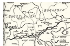
Χάρτης της Μακεδονίας που δημοσιεύτηκε στη βουλγαρική