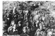
Η 1η Πανεθνική Συνδιάσκεψη της ΚΟΑΜ, που συνήλθε τον