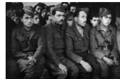
Τα «Δεκεμβριανά» και η συμφωνία της Βάρκιζας προκάλεσαν,