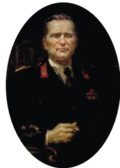
Η ίδρυση του Σλαβομακεδονικού Λαϊκού Απελευθερωτικού

Από την πρώτη κιόλας στιγμή της ίδρυσής του το ΣΝΟΦ, και ιδιαίτερα η οργάνωση Καστοριάς, πίεζε ασφυκτικά το ΚΚΕ να αναγνωρίσει στους σλαβόφωνους το δικαίωμα της αυτοδιάθεσης. «Γιατί εμάς δεν μας αφήνουν ελεύθερους να οικοδομήσουμε το δικό μας πολιτισμό και τα εθνικά μας ιδεώδη αφού και μεις αποτελούμε κάτι το ξέχωρο, δεν είμαστε Έλληνες, είμαστε Σλαβομακεδονική φυλή με διαφορετικά ιδεώδη, αλλά μας