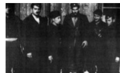
Το 1949 η 11η μεραρχία του ΔΣΕ μετονομάστηκε σε «Μακε-