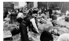
Η ανταλλαγή των πληθυσμών που αποφασίστηκε στη

Όμως η παγίωση της εθνολογικής εικόνας της ελληνικής Μακεδονίας υπέρ της ελληνικής πλευράς στα τέλη της δεκαετίας του 1920 δεν απομάκρυνε οριστικά το ενδεχόμενο μελλοντικών αντιπαραθέσεων και ανακατατάξεων. Αρκετοί στάθηκαν οι λόγοι που συνηγορούσαν σε αυτό. Καταρχάς το διεθνές πολιτικό σκηνικό εξακολουθούσε να παραμένει ρευστό και ευμετάβλητο, αφού οι εδαφικές ρυθμίσεις της συνθήκης των Βερσαλλιών (1919) αμφισβητούνταν έντονα από τις αναθεωρητικές χώρες. Αυτή η μεταβολή των ισορροπιών σε παγκόσμιο επίπεδο αντανακλώνταν αυτόματα στα Βαλκάνια, αφού τα εθνικά κράτη της περιοχής παραδοσιακά έσπευδαν να προσκολ-