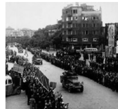
Τα σχέδια των Βουλγάρων αξιωματικών που βρίσκονταν στην

Η περίοδος της Κατοχής στην Ελλάδα προκάλεσε βαθιές ανακατατάξεις σε όλα τα επίπεδα. Μία από αυτές υπήρξε αναμφισβήτητα η ανάδειξη του EAM στη σημαντικότερη και πολυπληθέστερη αντιστασιακή οργάνωση. Το EAM εξαρχής υπερασπίστηκε με σθένος την ελληνικότητα της Μακεδονίας. Σε μεγάλη συγκέντρωσή του μάλιστα στην Αθήνα, τον Ιούλιο του 1943, κυριάρχησε το σύνθημα «Η Μακεδονία είναι και θα παραμείνει ελληνική». Η στάση αυτή είχε αναπόφευκτα οδηγήσει σε ψύχρανση των σχέσεων του ΚΚΕ με το Κομμουνιστικό Κόμμα Γιουγκοσλαβίας ( ΚΚΓ ). Ενδεικτική των πεποιθήσεων των Ελλήνων κομμουνιστών ήταν η δήλωση του Ανδρέα Τζήμα, τον Ιούνιο του 1944, στον επικεφαλής της σοβιετικής στρατιωτικής αποστολής στο επιτελείο του Τίτο, στρατηγό Ν. Κορνέγιεφ, ότι «οι εντυπώσεις των Γιουγκοσλάβων για την Ελλάδα και οι πληροφορίες που μεταδίδουν δεν είναι καθόλου αντικειμενικές... Μην κατανοώντας τη θέση μας στο Μακεδονικό ζήτημα, μας προκαλούν πολλές δυσκολίες στα σύνορα. Πολλά στελέχη τους στα σύνορα διαδίδουν ότι ο στρατός μας είναι φασιστικός, ότι στην ΚΕ του ΚΚΕ δρα η Ιντέλιτζεντ Σέρβις . Εμπόδισαν τους Μακεδόνες να λάβουν μέρος στις εκλογές της Πολιτικής Επιτροπής Εθνικής Απελευθέρωσης . Και αυτό παρά τη θερμή υποδοχή και υποστήριξη που βρίσκουν σε μας. Απευθύνομαι σε εσάς με την παράκληση να μεσολαβήσετε για τη διόρθωση του κακού. Οι Γιουγκοσλάβοι