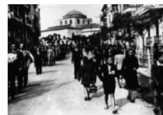
Στις συνομιλίες εκπροσώπων του ΚΚΕ με Βούλγαρους και