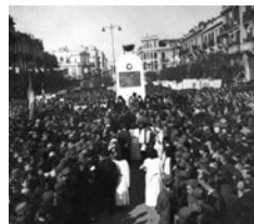
Οι Θεσσαλονικείς στους δρόμους την ημέρα της απελευθέρωσης.

Συνομιλία Αλ. Παπαναγιώτου με Ναούμ Πέγιωφ και Ρίστο Κιριάζοφσκι, Σκόπια, 18 Σεπτεμβρίου 1990, άκρως απόρρητο.