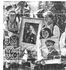
Φωτογραφία από τις ετοιμασίες για την υποδοχή του ιδρυτή της