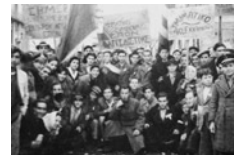
Στημιότυπα από τους εορτασμούς για τα δύο χρόνια της

Το 1946 βρήκε την ηγεσία του ΚΚΕ να προβληματίζεται έντονα, αναφορικά με την πολιτική που έπρεπε να υιοθετήσει στην αντιπαράθεσή της με τον αστικό πολιτικό κόσμο. Οι εκλογές είχαν ήδη προκηρυχθεί για τον Μάρτιο και τα περιθώρια για λάθος χειρισμούς είχαν στενέψει απελπιστικά. Μπροστά στα νέα δεδομένα, στα μέσα Φεβρουαρίου του 1946 συνήλθε στην Αθήνα η 2η Ολομέλεια της ΚΕ του ΚΚΕ. Στην πολιτική της απόφαση, ανάμεσα στα άλλα, επιβεβαιώθηκε η θέση του κόμματος πως τα σύνορα της Ελλάδας θεωρούνταν ιερά και απαραβίαστα και πως η Κύπρος και τα Δωδεκάνησα θα έπρεπε να ενωματοωθούν στην ελληνική επικράτεια. Παράλληλα το ΚΚΕ «καταγγέλλει τις μηχανορραφίες της αντίδρασης που χρηματοδοτεί και οργανώνει την αυτονομιστική κίνηση στη Μακεδονία, με μοναδικούς σκοπούς τη συκοφάντηση του ΚΚΕ και τη δημιουργία προστριβών με τους βόρειους γείτονες της χώρας. Θεωρεί σαν ύψιστο ζωτικό εθνικό συμφέρον για την Ελλάδα την πραγματοποίηση μιας ισότιμης δημοκρατικής και ειρηνικής συνεργασίας και συνεννόησης με τους βόρειους γείτονες Αλβανία, Γιουγκοσλαβία και Βουλγαρία». Σηπλίτευσε επίσης «τις καταδιώξεις και βιαιοπραγίες του επίσημου ελληνικού κράτους ενάντια στο σλαβόφωνο μακεδονικό πληθυσμό», που είχαν ως αποτέλεσμα την ενίσχυση των αυτονομιστικών στοιχείων. Διαβεβαίωσε ακόμη ότι το ΚΚΕ «δεν θα πάψει να παλεύει για ν' αναγνωριστούν τα δίκαια και η ισοτιμία στους Σλαβόφωνους που ζουν στην ελληνική Μακεδονία μέσα στα πλαίσια της ελληνικής επικράτειας». Εξάλλου κατά τη 2η Ολομέλεια συζητήθηκε