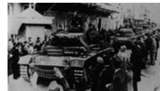
Κατά τη διάρκεια της Κατοχής οι Βούλγαροι κατέβαλαν προσπά-

Ρηματική Διακοίνωση Γ. Τσολάκογλου προς Γ. Άλτεμπουργκ, Αθήνα, 10 Απριλίου 1942.