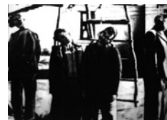
Η ελληνική αντίδραση στην προσπάθεια εκβουλισμού

αντάρτες, που σύντομα συνασπίστηκαν σε διάφορες αντιστασιακές οργανώσεις. Τον Σεπτέμβριο του 1943 στην περιοχή του Παγγαίου συγκροτήθηκε το 26ο Σύνταγμα του ΕΛΑΣ, ενώ τον Ιανουάριο του 1944 διάφοροι τοπικοί οπλαρχηγοί, με την ενίσχυση των Βρετανών, συνασπίστηκαν σε μια ενιαία οργάνωση με την επωνυμία Εθνικά Ανταρτικά Ομάδες (ΕΑΟ) , με γενικό αρχηγό τον Αντώνιο Φωστερίδη. Αλλά και μέσα στις πόλεις,