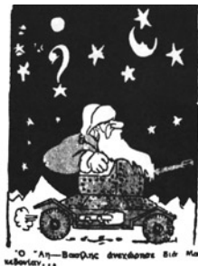
Στα τέλη του 1946 σημειώθηκαν δεκάδες επιθέσεις Σλαβο-