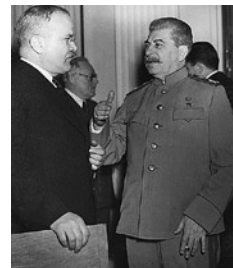
Την περίοδο των «Δεκεμβριανών», στα τέλη του 1944, έγινε

Η αρχή των αλλαγών εντοπίζεται κιόλας έναν μήνα αργότερα. Κατά το κλείσιμο των εργασιών της 12ης Ολομέλειας του ΚΚΕ (25-27 Ιουνίου 1945), ο Ζαχαριάδης διακήρυξε την υιοθέτηση της γραμμής της αυτοδιάθεσης των λαών. Στο πλαίσιο αυτό