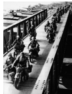
Την άνοιξη του 1941 οι Γερμανοί κατέλαβαν την ηπειρωτική

Όμως η προσπάθεια εκβουλγαρισμού της περιοχής προκάλεσε σύντομα την ελληνική αντίδραση. Υπό την καθοδήγηση κυρίως του ΚΚΕ, στα τέλη του καλοκαιριού του 1941 συγκροτήθηκε η πρώτη αντιστασιακή ομάδα περίπου 200 ατόμων που δρούσε στην περιοχή της Δράμας. Μάλιστα, τη νύχτα της 28ης Σεπτεμβρίου 1941 σημειώθηκαν συντονισμένες ένοπλες επιθέσεις ανταρτών εναντίον βουλγαρικών στόχων στη Δράμα και σε χωριά της γύρω περιοχής. Η αντίδραση των βουλγαρικών Αρχών ήταν άμεση. Την επομένη ο βουλγαρικός στρατός άρχισε εκτεταμένες επιχειρήσεις, κυρίως στην επαρχία, εναντίον των εστίων αντίστασης. Αρκετές υπήρξαν οι ωμότητες που διέπραξαν οι βούλγαροι στρατιώτες, όμως η εκτέλεση περίπου 200 κατοίκων του χωριού Δοξάτο της Δράμας καταγράφηκε ως μία από τις φρικιαστικότερες σελίδες στην ιστορία της Κατοχής. Η πρώιμη αυτή αποτυχία των Ελλήνων αντιστασιακών στάθηκε πρόσκαιρη. Από τις αρχές κιόλας του 1942 τα βουνά της περιοχής γέμισαν σταδιακά από