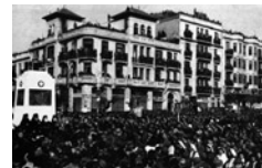
Η «Βουλγαρική Λέσχη» της Θεσσαλονίκης έκλεισε τον