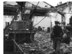
Στις αρχές του 1949 η 5η Ολομέλεια αναγνώρισε το δικαίω-

Η επίσημη μεταστροφή της πολιτικής του ΚΚΕ αναφορικά με το Μακεδονικό ζήτημα αποκαλύφθηκε στη διάρκεια της 5ης Ολομέλειας, στις 30 και 31 Ιανουαρίου 1949. Μια