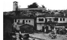
Τον Απρίλιο του 1945 η προπαγάνδα για μία «ελεύθερη