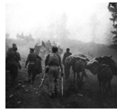
Στα τέλη του 1944 οι δυνάμεις του ΕΛΑΣ επιδόθηκαν σε

Η ίδρυση του ΝΟΦ καθώς και οι δεσμοί του με το Κομμουνιστικό Κόμμα Μακεδονίας (ΚΚΜ) και το ΚΚΓ αποτελούν ζήτημα που εξακολουθεί να παραμένει ανεξιχνίαστο από την επιστημονική έρευνα, τουλάχιστον για όσο διάστημα το αρχείο του ΚΚΜ διατηρείται κλειστό. Η ελληνική βιβλιογραφία δεν διατηρεί καμία επιφύλαξη ότι ο σχηματισμός του ΝΟΦ υπήρξε γιουγκοσλαβική πρωτοβουλία, με επιδιωκόμενο στόχο την αποσταθεροποίηση της ελληνικής Μακεδονίας και την ένωσή της με τη ΛΔΜ. Η σλαβομακεδονική βιβλιογραφία από την πλευρά της εμφανίζεται αντιφατική και προσκολλημένη στο όραμα της οικοδόμησης του εθνικού μύθου, ερμηνευμένου βέβαια πάντοτε κατά το δοκούν. Όσο η ΛΔΜ αποτελούσε τμήμα της ενιαίας Γιουγκοσλαβίας, προβάλλονταν κυρίως ο αγώνας του ΝΟΦ για τα εθνικά δίκαια των σλαβόφωνων της Ελλάδας, χωρίς παράλληλες αναφορές στις διεθνείς του διασυνδέσεις. Μετά την κατάρρευση όμως της γιουγκοσλαβικής ομοσπονδίας, στην ΠΓΔΜ έκαναν την εμφάνισή τους μελέτες που αναφέρονταν στις σχέσεις του ΚΚΜ με το ΝΟΦ , χωρίς όμως να διαθέτουν επαρκή αρχαιακή τεκμηρίωση. Αποτελούσαν, τις περισσότερες φορές, τοποθετήσεις παλαιάμαχων ανταρτών και πρωταγωνιστών της περιόδου –κυρίως του Ρίστο Κιριάζοφσκι– οι οποίοι μετέ-