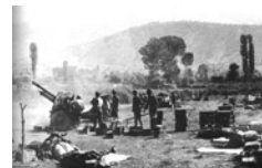
Πυροβολαρχία του Εθνικού Στρατού σε περιοχή της Καστο-

Μερικές εβδομάδες αργότερα, στις 25 και 26 Μαρτίου, στο χωριό Φαράδες των Πρεσπών πραγματοποιήθηκε το 2ο Συνέδριο του ΝΟΦ. Ενώπιον 700 αντιπροσώπων ο Ζαχαριάδης, αφού επιβράβευσε τον «μακεδονικό» λαό για την προσφορά του, επέμεινε στην αναγκαιότητα της ενότητας του με τον ελληνικό λαό, προκειμένου να επέλθει η νίκη. Το συνέδριο, ολοκληρώνοντας τις εργασίες του, καταδίκασε την ομάδα του Κεραμιτζιέφ και διακήρυξε το δικαίωμα της αυτοδιάθεσης του «μακεδο-