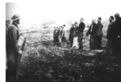
Εκτελέσεις κατηγορουμένων για συμμετοχή σε ενέργειες που

Τον Σεπτέμβριο του 1945 συνήλθε στη Θεσσαλονίκη η 2η Συνδιάσκεψη της οργάνωσης περιοχής Μακεδονίας-Θράκης του ΚΚΕ . Σε αυτήν διακηρύχθηκε εκ νέου η ελληνικότητα της Μακεδονίας και της Θράκης. Όμως έναν μήνα αργότερα στον κινηματογράφο Τιτάνια επί της οδού Πανεπιστημίου στην Αθήνα άρχισε τις εργασίες του το 7ο Συνέδριο του ΚΚΕ . Στην ομιλία του ο Ζαχαριάδης καταδίκασε υπό τη σκέπη τεράστιων πορτραίτων των Μαρξ, Ένγκελς, Λένιν και Στάλιν τις «εξολοθρευτικές μεθόδους που εφαρμόζει ο φασισμός του μαύρου μετώπου έναντι της σλαβομακεδονικής μειονότητας» και τόνισε ότι ο απόλυτος σεβασμός των δικαιωμάτων της καθώς και η παραχώρηση σε αυτήν καθεστώτος πλήρους εθνικής, θρησκευτικής και γλωσσικής ισοτιμίας αποτελούσε βασική προϋπόθεση για την ειρηνική συμβίωση με τις γιουγκοσλαβικές δημοκρατίες. Παράλληλα, εξέφρασε την πεποίθηση ότι με αυτόν τον τρόπο θα αποφεύγονταν οι διενέξεις, οι λανθασμένες ερμηνείες και οι λογομαχίες για την ελληνική Μακεδονία, «που σήμερα κατοικείται κατά 90% από Έλληνες και αποτελεί αναπόσπαστο τμήμα