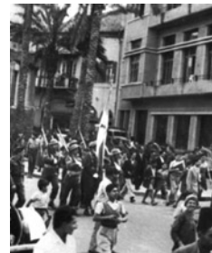
Μονάδες πεζικού του Εθνικού Στρατού στην πόλη της Κομο-

Λίγο αργότερα, στις 2 Αυγούστου, και ενώ οι φοβερές συγκρούσεις στον Γράμμο και στο Βίτσι ήταν προ των πυλών, σε μια ύστατη προσπάθεια κινητοποίησης του σλαβόφωνου πληθυσμού, συνήλθε η 1η Πανεθνική Συνδιάσκεψη της ΚΟΑΜ. Στην απόφασή της η συνδιάσκεψη επιβεβαίωσε την ενότητα του ελληνικού με τον «μακεδονικό» λαό και την κοινή τους αφοσίωση στις Λαϊκές Δημοκρατίες με επικεφαλής την ΕΣΣΔ, ενώ παράλληλα κάλεσε τον «μακεδονικό» λαό να αγωνιστεί με αυταπάρνηση για την υπεράσπιση των ελεύθερων βουνών του Γράμμου και του Βιτσιού. Ήταν όμως πλέον αργά. Η διαφανόμενη από αρκετούς μήνες πριν ήττα του ΔΣΕ, στα τέλη Αυγούστου 1949, διέψευσε οριστικά κάθε ελπίδα των Σλαβομακεδόνων ανταρτών για την πραγμάτωση των ονείρων τους, όποια και αν ήταν τελικά αυτά.