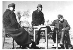
Το Γενικό Αρχηγείο του Δημοκρατικού Στρατού Ελλάδας (ΔΣΕ)