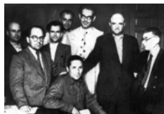
Φωτογραφία από την υποδοχή του Νίκου Ζαχαριάδη στην

δεν ζει εκεί ούτε ένας Έλληνας και αδιάφορο αν αυτό θα εσήμαινε βέβαια πόλεμο με τον τακτικόν στρατόν του Τίτο, που θα πει ένα εκατομμύριο άνδρες αυτή τη στιγμή. Αν ο πρωθυπουργός στρατάρχης Τίτο και οι συνεργάτες του γιουγκοσλαβικού συνασπισμού της Αριστεράς είχαν τα μυαλά που έχει η ελληνική Δεξιά θα ζητούσαν βέβαια εις αντάλλαγμα τη Θεσσαλονίκη... Εκεί όμως που είναι στο φόρτε του ο έξαλλος σοβινισμός είναι η καταβρόχηση του χάρτη της Βουλγαρίας. Τουλάχιστον την νότιον Βουλγαρία! Οι μεν, ολόκληρον την Ανατολικήν Ρωμυλιαν οι δε, την ίδια τη Σόφια οι άλλοι. Δεν σκέφτηκαν ποτέ ότι ούτε ένας Έλληνας δεν ζει στα εδάφη αυτά».