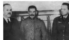
Στα τέλη Ιουνίου του 1948 επήλθε ρήξη στις σχέσεις Τίτο-

Ο Ζαχαριάδης, φοβούμενος πως τυχόν ανεξέλεγκτες αντιδράσεις του ΝΟΦ μπορούσαν να φέρουν σε δύσκολη θέση το ΚΚΕ , προσπάθησε να θέσει υπό τον πλήρη έλεγχο του την οργάνωση. Έτσι στις 8 Αυγούστου 1948, στο χωριό Οξυά της Φλώρινας, συνήλθε η 1η Ολομέλεια του Κεντρικού Συμβουλίου του ΝΟΦ . Εκεί οι σύνεδροι, υπό